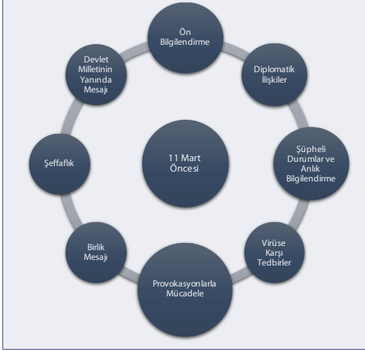
ŞEKİL 1. 11 MART ÖNCESİ SÜREÇ YÖNETİMİNDE ÖNE ÇIKAN TEMALAR

ilgili olarak detaylı ön bilgilendirme yapmıştır. Koca, virüsün oluşturabileceği tehlikenin farkında olduklarının altını çizmiş Türkiye'ye gelen yolcularda ateş, öksürük ve nefes güçlüğü olma durumunda gerekli her türlü tedbirin alındığını belirtmiştir. 1 Ön bilgilendirme sürecinde Türkiye'nin mevcut ilaç stok bilgileri de kamuoyuyla paylaşılmıştır. Dünya Sağlık Örgütü (DSÖ) virüsü tehdit olarak algılamadan önce Türkiye'nin gerekli önlemleri hayata geçirdiği ve bir Bilim Kurulu oluşturarak 31 Ocak itibarıyla dört toplantı gerçekleştirdiği sosyal medya üzerinden duyurulmuştur. Sağlık Bakanlığının resmi Twitter hesabından Bilim Kurulu üyelerinin kısa raporları, çeşitli infografikler ve görsel içerikler ile koronavirüse dair geniş kapsamlı bilgilendirici içerikler paylaşılmıştır.