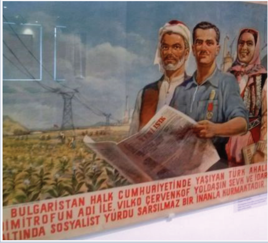
GÖRSEL 1. BULGARİSTAN'DA KOMÜNİST DÖNEMDE KULLANILMIŞ BİR AFİŞ

Bu fotoğraf, Temmuz 2013'te Bulgaristan, Sofya'daki Sosyalist Sanat Müzesi'nde çekilmiştir. Öndeki kişi, Türkçe olarak basılmış Yeni Işık gazetesini tuttuğu, arkasındaki kadın ve erkeğin de geleneksel Türk kıyafetleri içinde olduğu görülmektedir. Posterin altında "Bulgaristan Halk Cumhuriyeti'nde Yaşayan Türk Ahalisi Dimitrov'un Adı ile, Vilko Çervenkov Yoldaşın Sevk ve İdaresi Altında Sosyalist Yurdu Sarsılmaz Bir İnanla Kurmaktadır" denilmektedir. Komünist yönetimin bu ılımlı tavrının 1957'de "Türk düşmanlığı"na dönmesiyle ise anadilde eğitim hakkı tırpanlanmış, Türkçe dergi ve kitap basımlarına yasaklar getirilmeye başlanmıştır. 64 Bugün Bulgaristan'da soydaşların Türkçeyi yeterince iyi ve etkin kullanamayışının en önemli sebebi olarak 60'lar ve sonrasında sert bir şekilde uygulanan bu dil (ve din) karşıtı politikalar gösterilebilir.