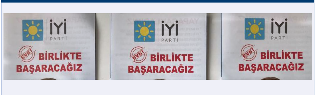
GÖRSEL 14. YEREL SEÇİM BÜYÜKŞEHİR ADAYI BROŞÜRLERİNDE KURUMSAL KONSEPTİN DIŞINDA FARKLI SLOGAN KULLANIMI ÖRNEĞİ

Yerel seçim manifestosunun girişinde Meral Akşener'in fotoğrafı ve sunuş yazısının ardından "İyi Belediyecilik İlkeleri" ana başlığı yer almakta ve bunun ardından "İYİ Belediyecilik Andı"na iki sayfada yer verilmektedir. Sonrasında ise İYİ belediyecilik ilkelerine referansla yirmi beşinci