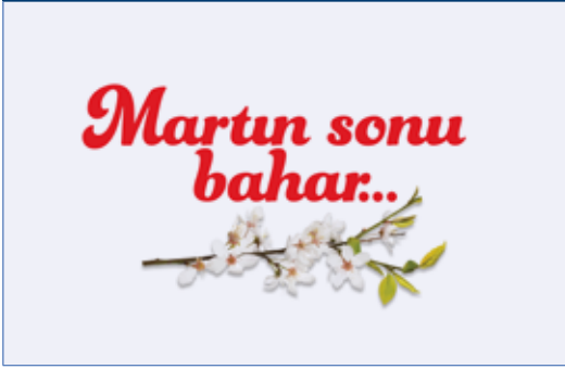
GÖRSEL 3. CHP’NİN 31 MART 2019 YEREL SEÇİM SLOGANI

Yine her bölge için ayrı sloganların kullanılacağına belirtildiği CHP Yerel Seçim 2019 Görsel İletişim Kılavuzu’nda adaylardan hazırladıkları broşür veya kartvizitlerde “Seni seviyorum” ifadesinin altına aday olduğu il ya da ilçeyi eklemesi istenmiştir. Kullanılacak yazı fontları, araç giydirme şekilleri ve promosyonlara ilişkin bilgiler de kılavuzda yer almıştır. 60