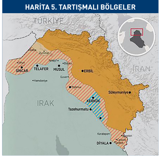
Kaynak: "Irak Güçlerinin 'Tartışmalı Bölgelere' Yönelik Operasyonu", Anadolu Ajansı, 18 Ekim 2017.

Türkiye-İrak ticaretini etkileyen gelişmelerden bir tanesi de petrol fiyatlarında yaşanan dalgalanmalardır. Federal bütçe gelirlerinin yüzde 85'i petrol gelirlerine dayanan Irak, petrol fiyatlarında yaşanan dalgalanmalardan etkilenmektedir. 8 2018'de 88 milyar dolar olan Irak bütçesinin 70 milyar doları petrol satışından elde edilen gelirlerden oluşmaktadır. 2014-2017 arasında DEAŞ petrol sahalarını ve boru hatlarını tahrip