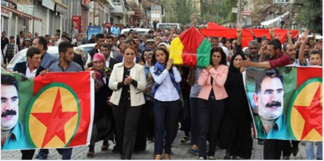
Kaynak: “Teröristin Cenazesine Katılan HDP’li Vekile Fezleke”, Takvim , 15 Eylül 2015.

getirilmezken Türk Dışişleri Bakanı Mevlüt Çavuşoğlu’nun Solingen faciasında hayatını yitiren Türk vatandaşlarını anma toplantısına katılacağından sonra bu ziyaretin seçim yasağı düzenlemesine aykırı olup olmadığına yönelik tartışmaların başlatılması dikkat çekicidir. Nitekim Dışişleri Bakanı Heiko Maas kamuoyundan gelen tepkiler neticesinde ziyaretin seçim kampanyası çerçevesinde olmadığı ve sadece bir anma ve taziye ziyareti niteliği taşıdığı açıklamasını yapmak zorunda kalmıştır. Türk bir bakanın ırkçı saldırılar sonucu beş çocuğunu kaybeden Türk aileye yapacağı ziyaretin bile tartışma konusu haline gelebilmesi Alman kamuoyunda Türk hükümeti ve AK Parti’ye karşı yürütülen karşıt propagandanın ne denli etkin olduğunu göstermesi açısından ilginçtir. 25