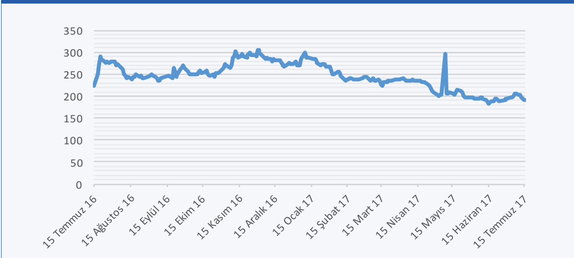
GRAFİK 3. CDS RİSK PRİMİ (15 TEMMUZ 2016-15 TEMMUZ 2017)