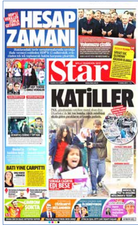
Resim 125, Star, 5 Kasım 2016