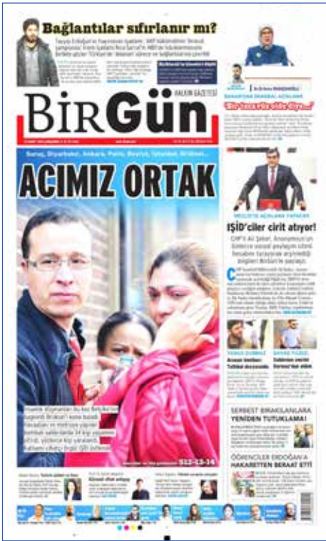
Resim 35, BirGün, 23 Mart 2016