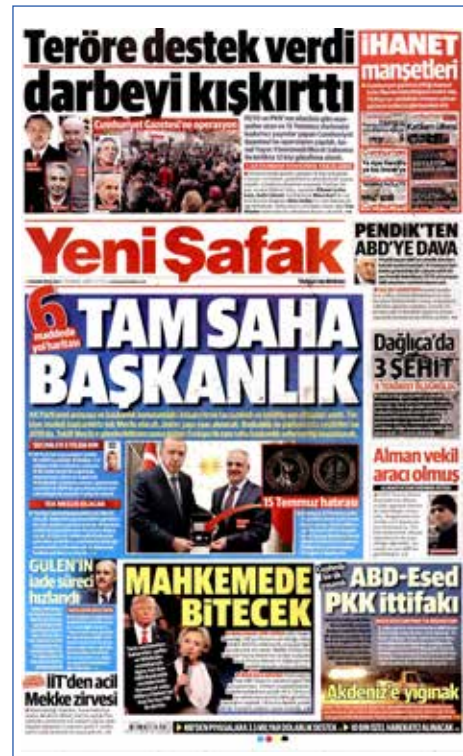
Resim 121, Yeni Şafak, 1 Ekim 2016