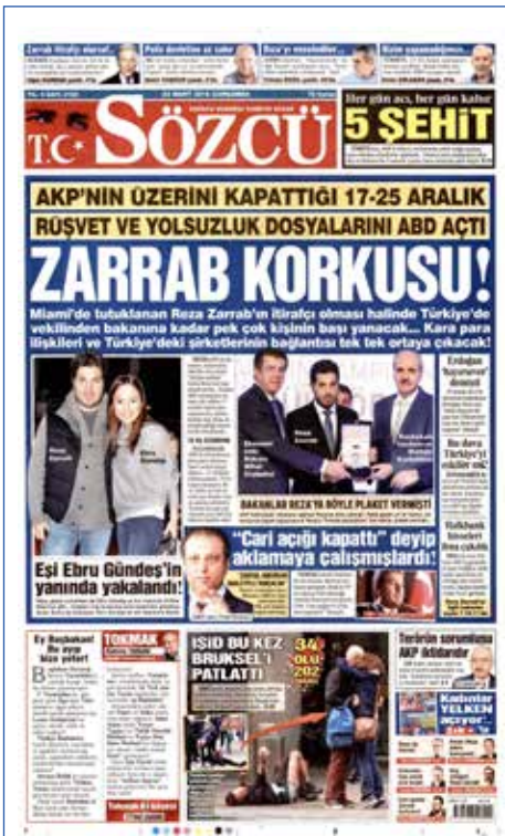
Resim 37, Sözcü, 23 Mart 2016