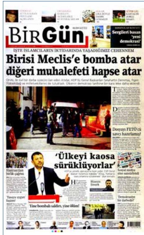
Resim 122, BirGün, 5 Kasım 2016