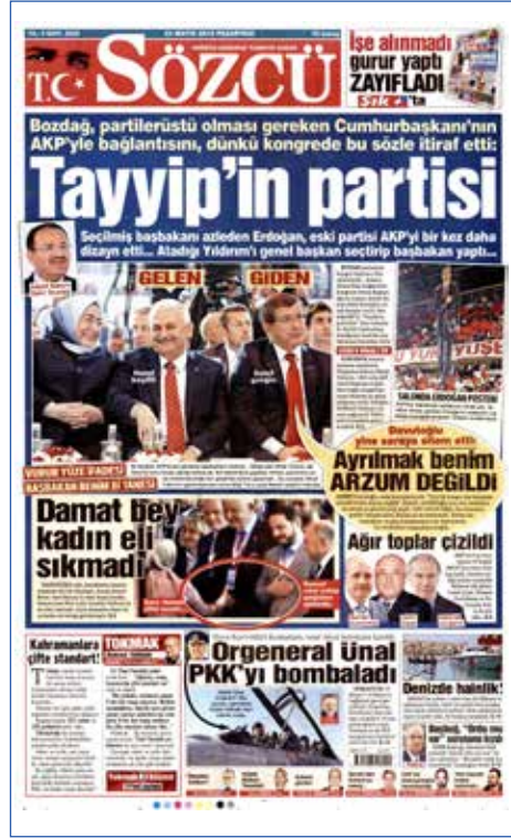
Resim 52, Sözcü, 23 Mayıs 2016