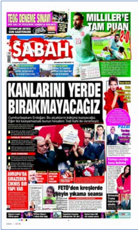
Resim 130, Sabah, 13 Kasım 2016