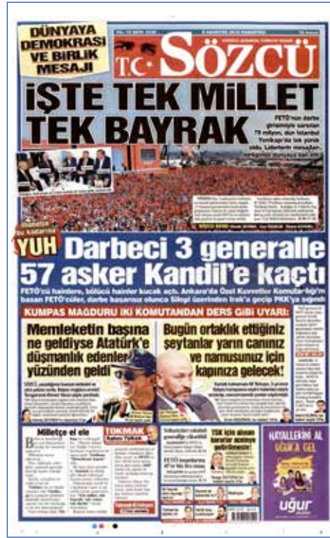
Resim 94, Sözcü, 8 Ağustos 2016