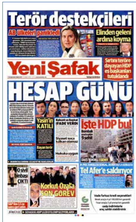
Resim 127, Yeni Şafak, 5 Kasım 2016