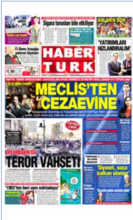
Resim 123, Haber Türk, 5 Kasım 2016

Dokunulmazlıkları kaldırıldıktan sonra haklarında fezleke bulunan ve ifade vermeye gitmeyen HDP milletvekilleri 4 Kasım günü gözaltına alındı. Gözaltına alınan milletvekillerinin “terör örgütü PKK propagandası yapmak”, “suçu ve suçluyu övmek”, “halkı kin ve düşmanlığa tahrik”, “silahlı terör örgütüne üye olmak” ve “devletin birliğini ve bütünlüğünü bozmaya teşebbüs” gibi suçlardan fezlekesi bulunuyordu. Soruşturma kapsamında eş başkanlar Selahattin Demirtaş ve Figen Yüksekdağ ile İdris Baluken'in aralarında bulunduğu dokuz milletvekili tutuklandı. Gözaltı kararı sonrası PKK terör örgütü Diyarbakır Bağlar'daki polis merkezine bomba yüklü araçla saldırı düzenledi. Saldırı sonucu 2 polis ile 7 sivil şehit olurken 100 kişi yaralandı. Birçok gazete HDP'li milletvekillerinin tutuklanmasını yerinde bulup bu menfur saldırının buna bir kanıt olduğuna işaret ederken BirGün gazetesi terör destekçisi milletvekillerin tutuklanmasını “Demokrasi tarihine bir kara leke daha eklendi” şeklinde yorumladı.