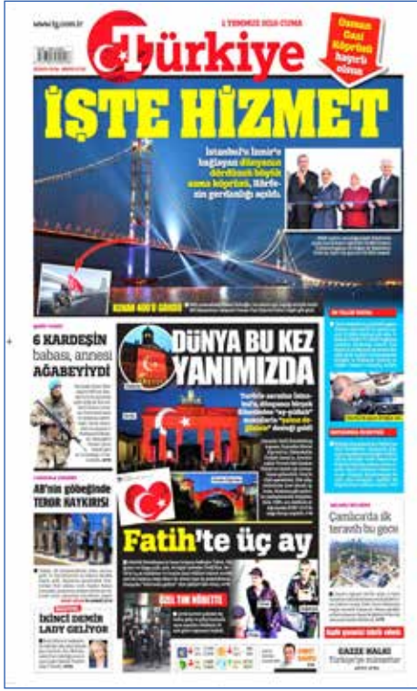
Resim 69, Türkiye, 1 Temmuz 2016