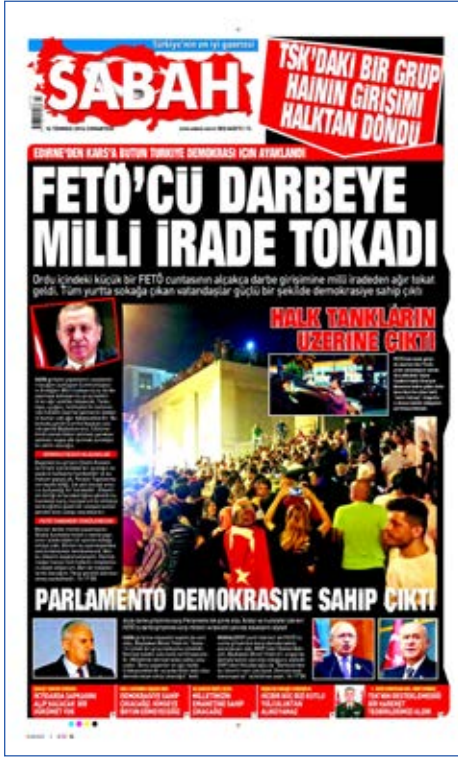
Resim 74, Sabah, 16 Temmuz 2016