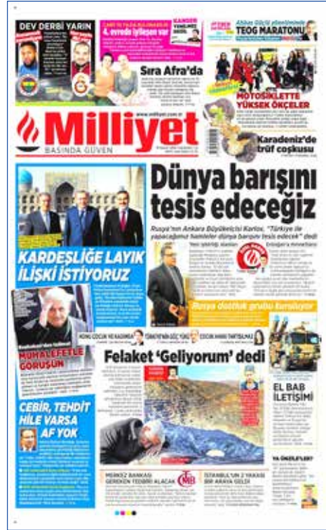
Resim 134, Milliyet, 19 Kasım 2016