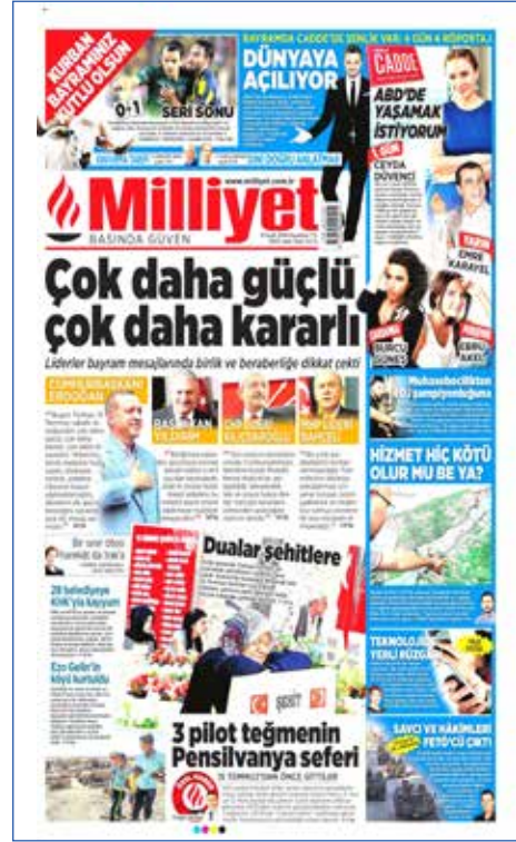
Resim 112, Milliyet, 12 Eylül 2016