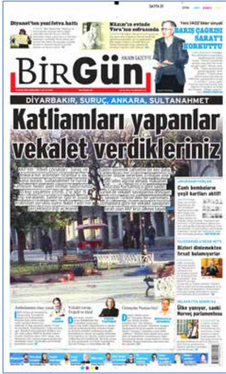
Resim 11, BirGün, 13 Ocak 2016