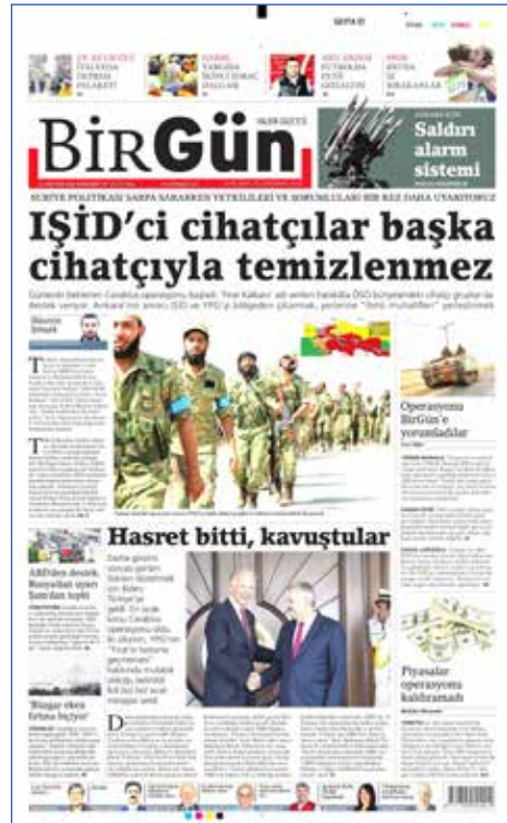
Resim 102, BirGün, 25 Ağustos 2016