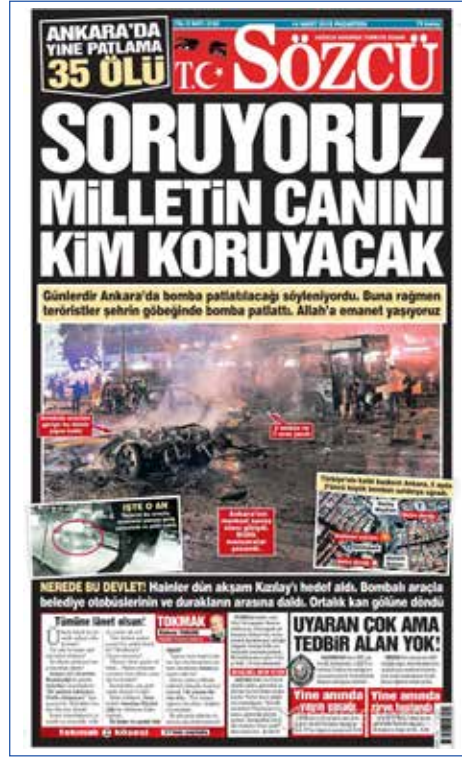
Resim 28, Sözcü, 14 Mart 2016