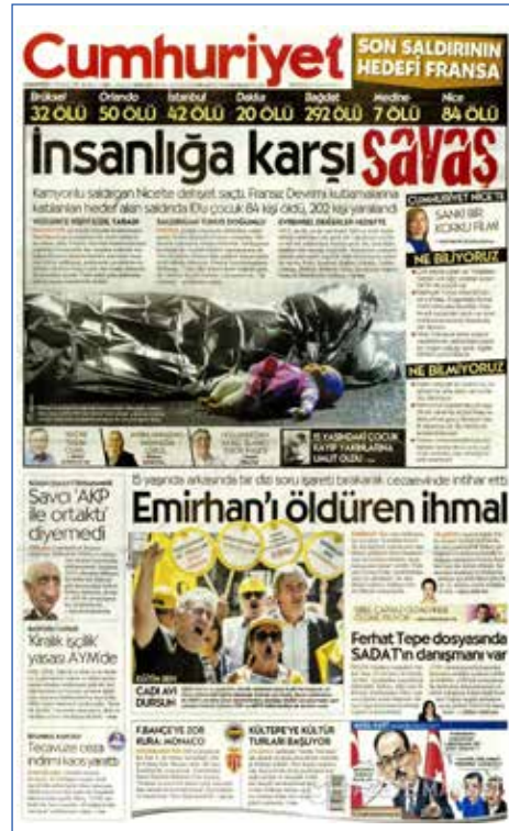
Resim 81, Cumhuriyet, 16 Temmuz 2016