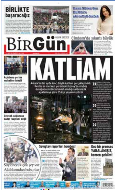
Resim 27, BirGün, 14 Mart 2016