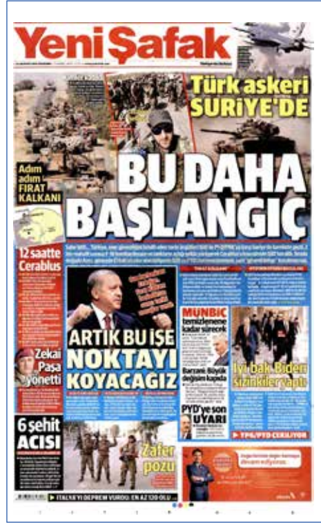
Resim 100, Yeni Şafak, 25 Ağustos 2016