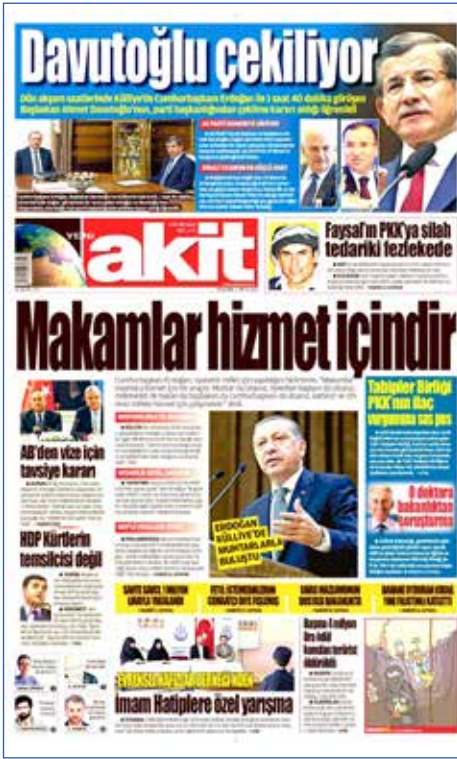
Resim 45, Akit, 5 Mayıs 2016