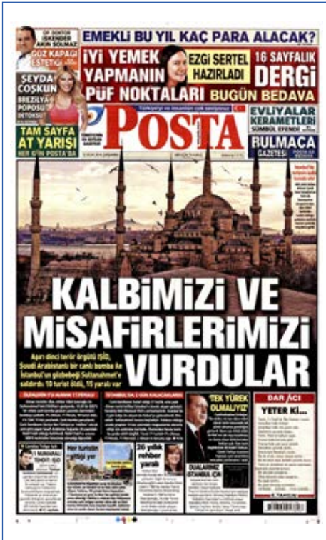
Resim 9, Posta , 13 Ocak 2016

12 Ocak'ta İstanbul Sultanahmet Meydanı'nda bir patlama oldu. Cumhurbaşkanı Erdoğan, Türkiye'yi yasa boğan ve dünya basınında da son dakika haberi olarak geçilen patlamanın Suriye kökenli bir canlı bomba tarafından gerçekleştirildiğini açıkladı. Türkiye'yi sarsan terör saldırısında canlı bomba Alman Çeşmesi civarında bulunan Alman ve Perululardan oluşan turist grubunu hedef aldı. DEAŞ tarafından gerçekleştirilen hain saldırıda toplam 10 kişi hayatını kaybetti, 15 kişi de yaralandı. Saldırdan sonraki günlerde BirGün ve Cumhuriyet gibi gazeteler yaşananlardan hükümeti sorumlu tutan manşetler attılar. Aynı gazeteler olay sonrasında ülkenin güvensiz olduğuna ilişkin propaganda faaliyetlerini sürdürdüler.