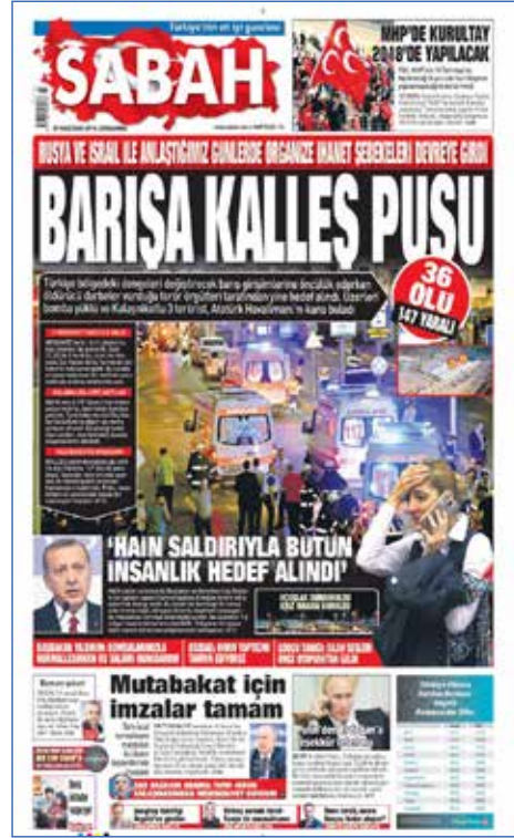
Resim 64, Sabah, 29 Haziran 2016