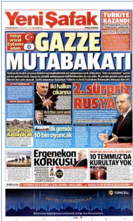
Resim 59, Yeni Şafak , 28 Haziran 2016

Türkiye ile İsrail, Mavi Marmara saldırısının ardından kopan ilişkilerin altı yıl sonra 27 Haziran 2016'da normalleştirilmesi için anlaştı. İsrail askerleri Gazze'ye yardım ulaştırmak amacıyla yola çıkan yardım gemisi Mavi Marmara'ya uluslararası sular-da saldırmış ve 10 kişiyi öldürmüştü. Olayın ardından Türkiye-İsrail ilişkileri gerilmiş ve kopma noktasına gelmişti. Ancak İsrail 27 Haziran 2016'da Türkiye'nin "özür ve tazminat" şartlarını yerine getirmeyi ve Gazze'ye yönelik ambargonun hafifletilmesini kabul etti. İsrail'in, Türkiye'nin şartlarını kabul etmesiyle birlikte Türkiye-İsrail ilişkilerinde normalleşme dönemi başladı. Yeni Şafak ve Star gazeteleri Gazze'nin bu mutabakat sonucu rahatlayacağını belirtirken Cumhuriyet , Sözcü ve BirGün gazeteleri olayı Türkiye'nin zayıflık göstermesi şeklinde manşetlerine taşıdı.