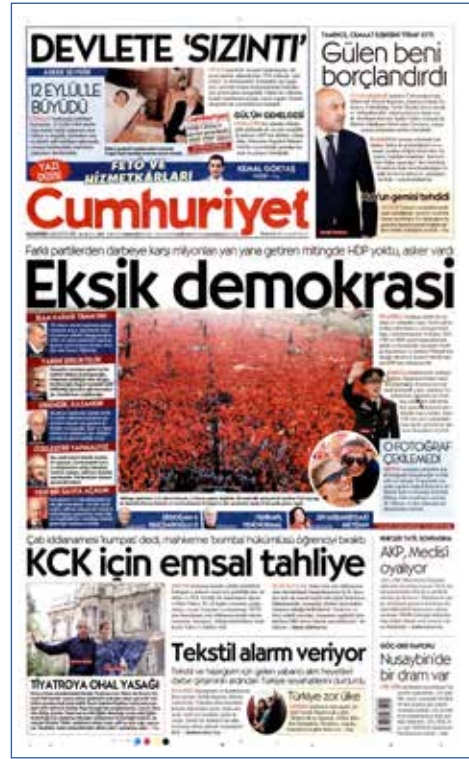
Resim 98, Cumhuriyet, 8 Ağustos 2016