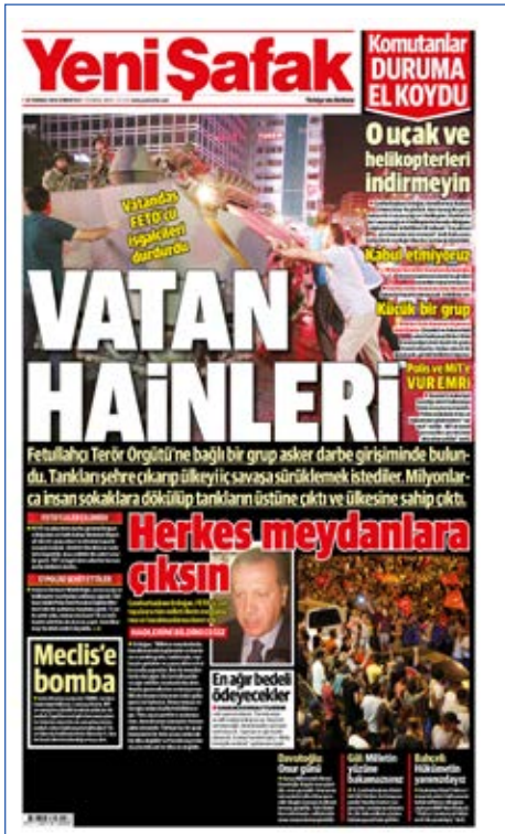
Resim 76, Yeni Şafak, 16 Temmuz 2016