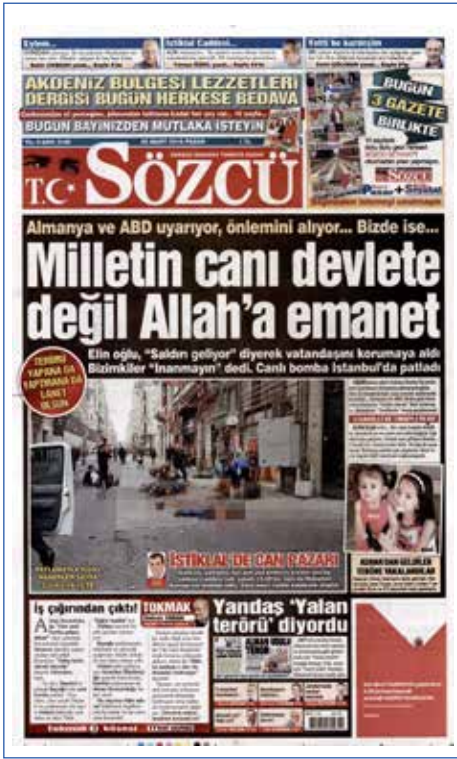
Resim 29, Sözcü, 20 Mart 2016