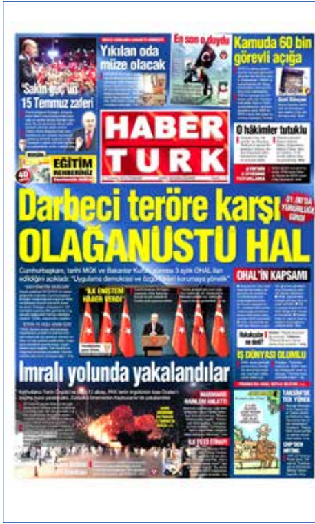
Resim 87, Haber Türk, 21 Temmuz 2016