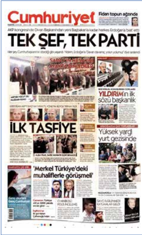
Resim 51, Cumhuriyet, 23 Mayıs 2016

AK Parti'nin 22 Mayıs tarihli 2. Olağanüstü Büyük Kongresi'nde AK Parti Merkez Yürütme Kurulu'nun isteğiyle tek aday olan Binali Yıldırım, 1.411 delegeden 1.405 oy olarak AK Parti'nin yeni genel başkanı seçildi. Sözcü ve Cumhuriyet gazeteleri kongredeki Cumhurbaşkanı'na koşulsuz itaat etmekle suçlayarak sonucu manşetlerine "Tayyip'in Partisi" ve "Tek Şef, Tek Parti" olarak taşırken, Yeni Şafak ve Star gibi gazeteler başkanlık yolunda yeni bir dönemin başladığı yönünde manşetler attılar.