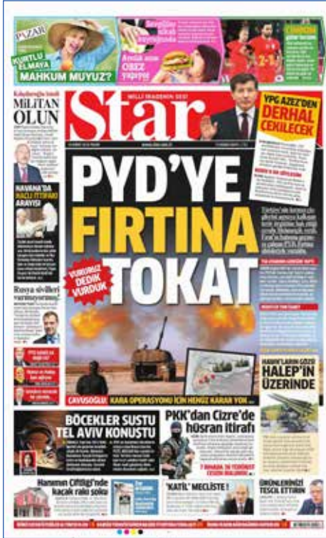
Resim 17, Star , 14 Şubat 2016

13 Şubat günü sınırdan Türk askerine ateş açılması üzerine TSK, Kilis'te konuşlandırılmış Fırtına obüsleriyle Suriye'deki PYD mevzilerini vurdu. Askeri kaynaklar PYD'nin üs bölgesine ateş açmasının ardından angajman kuralları gereği TSK tarafından karşılık verildiğini belirtti. Türkiye topraklarına karşı açık bir tehdit oluşturan PYD'nin bu hamlesine karşılık TSK'nın yaptığı hamleyi Star ve Hürriyet gazeteleri yerinde bulurken, Cumhuriyet ve Sözcü gazeteleri ise hükümeti ülkeyi savaş ve kaos ortamına sürüklemekle suçladı.