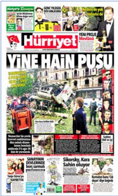
Resim 55, Hürriyet, 8 Haziran 2016