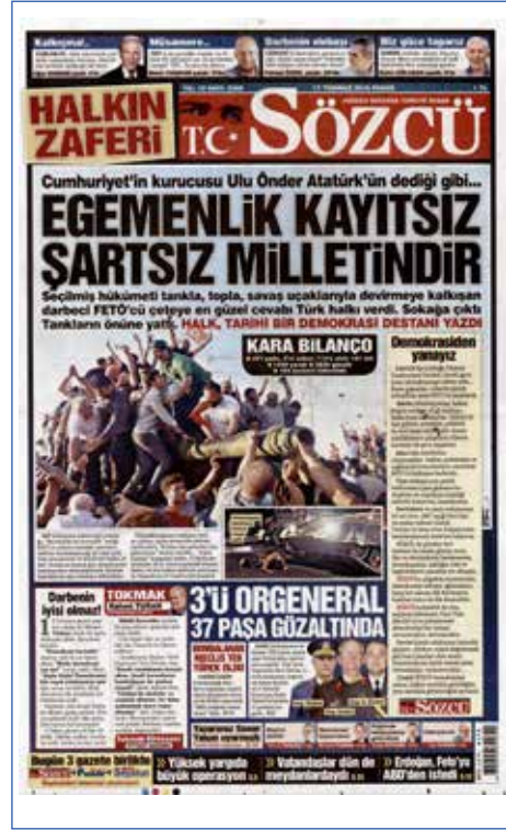
Resim 83, Sözcü, 17 Temmuz 2016