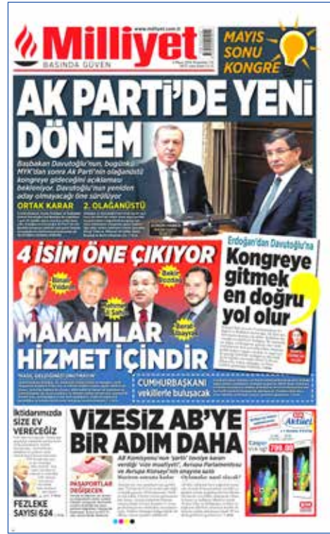
Resim 46, Milliyet, 5 Mayıs 2016