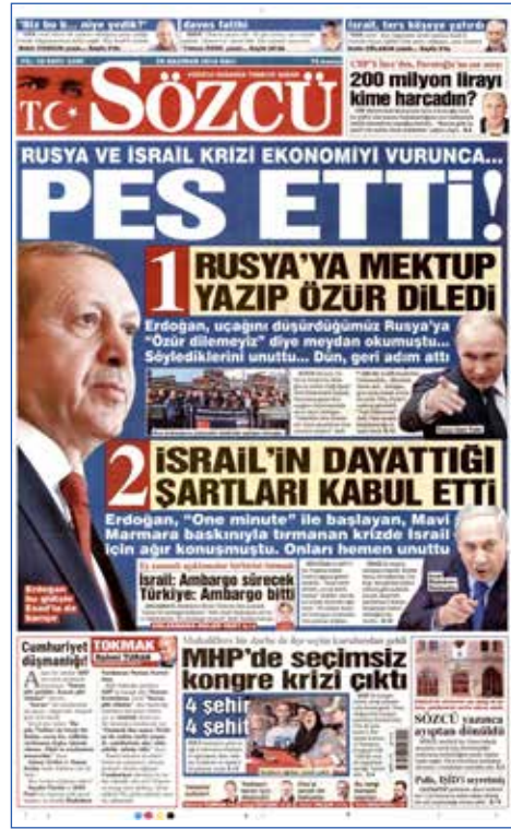
Resim 62, Sözcü, 28 Haziran 2016