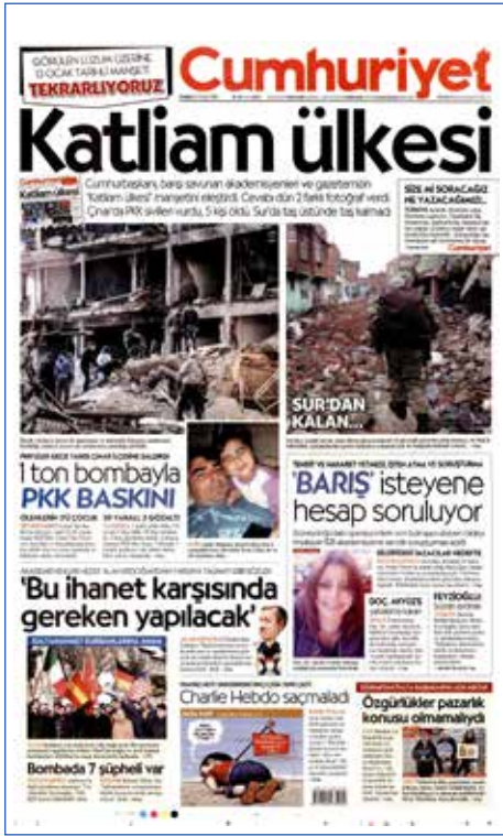
Resim 6, Cumhuriyet, 15 Ocak 2016