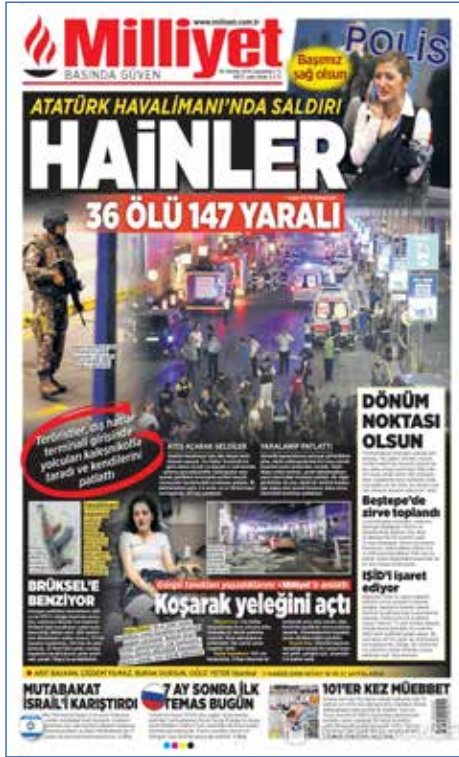
Resim 63, Milliyet, 29 Haziran 2016