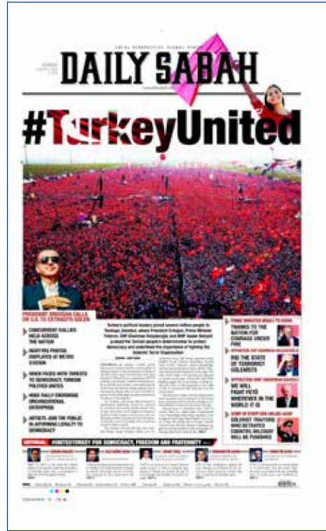
Resim 92, Daily Sabah , 8 Ağustos 2016