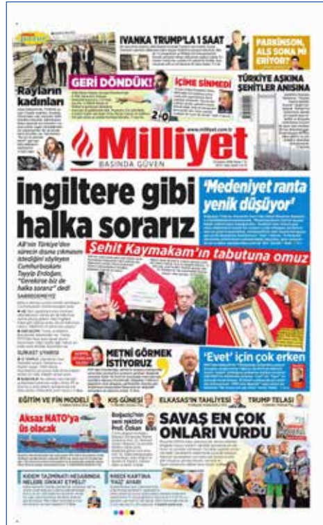
Resim 129, Milliyet, 13 Kasım 2016