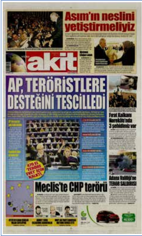
Resim 140, Akit, 25 Kasım 2016