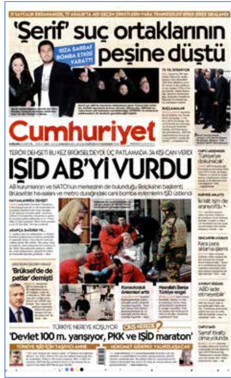
Resim 5: Cumhuriyet , 23 Mart 2016

Brüksel'in AB ve NATO gibi uluslararası kurumların merkezi olması yapılan terör saldırılarının tüm dünyada yankılanmasına neden olmuştur. Türkiye'deki terör saldırılarını muhalefet imkanı olarak gören yayın organlarının Belçika'daki eylemler için birlik çağrısı yapması ironik bir tavır olarak karşımızda durmaktadır. Brüksel saldırısından günler önce Ankara ve Taksim'de yapılan saldırılarda devleti güvenlik zaafı gerekçesiyle suçlayan BirGün ve Cumhuriyet gibi gazetelerin Brüksel saldırılarını haberleştirme pratikleri birbirinden oldukça farklıdır. BirGün gazetesinin Brüksel saldırısı sonrasında "Acımız Ortak", Cumhuriyet gazetesinin ise "İŞİD AB'yi Vurdu" manşetleri ile Türkiye'deki saldırılar sonrasındaki manşetler karşılaştırıldığında sorunun sadece terör olmadığı da açığa çıkmaktadır.