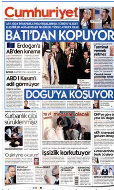
Resim 42, Cumhuriyet, 15 Nisan 2016