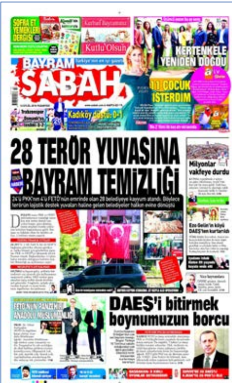
Resim 109, Sabah, 12 Eylül 2016