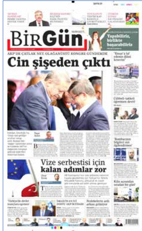
Resim 44, BirGün, 5 Mayıs 2016