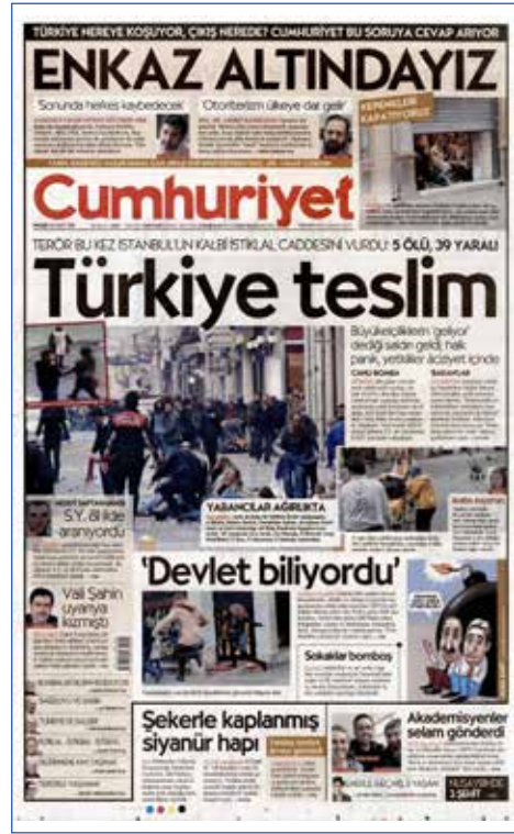
Resim 30, Cumhuriyet, 20 Mart 2016