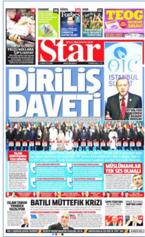
Resim 41, Star, 15 Nisan 2016