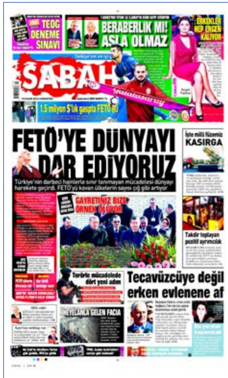
Resim 132, Sabah, 19 Kasım 2016