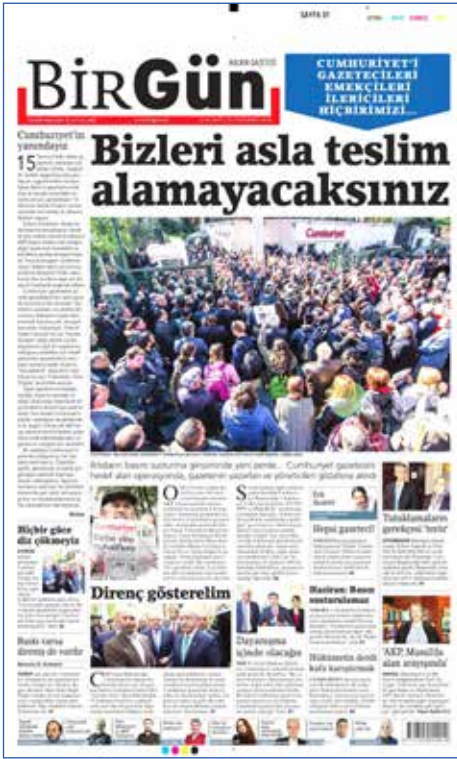
Resim 118, BirGün, 1 Kasım 2016