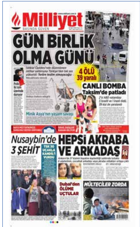
Resim 32, Milliyet, 20 Mart 2016