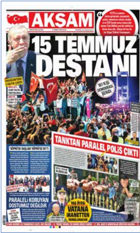
Resim 78, Akşam, 17 Temmuz 2016