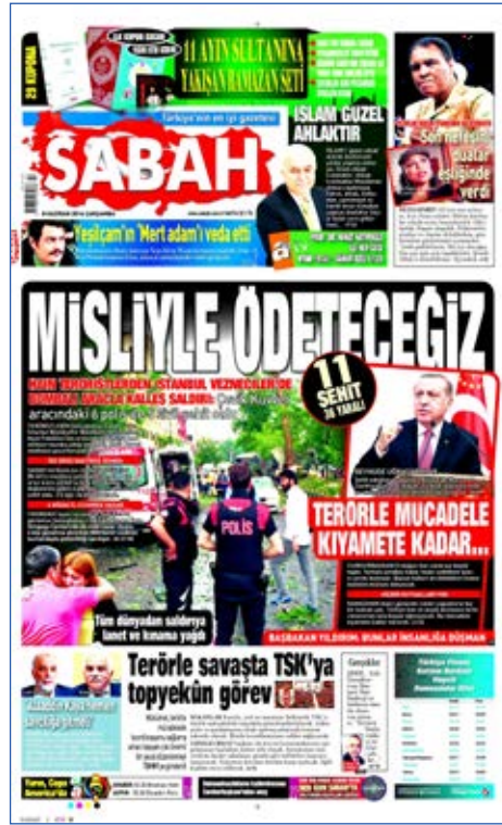
Resim 56, Sabah, 8 Haziran 2016