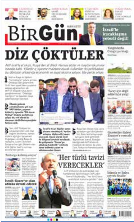
Resim 61, BirGün, 28 Haziran 2016