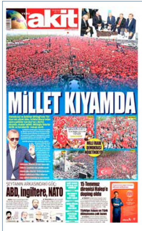
Resim 96, Akit, 8 Ağustos 2016