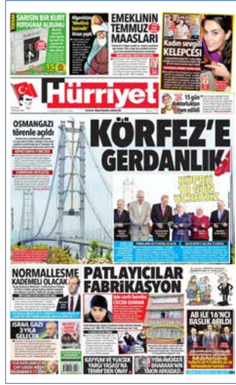
Resim 70, Hürriyet, 1 Temmuz 2016