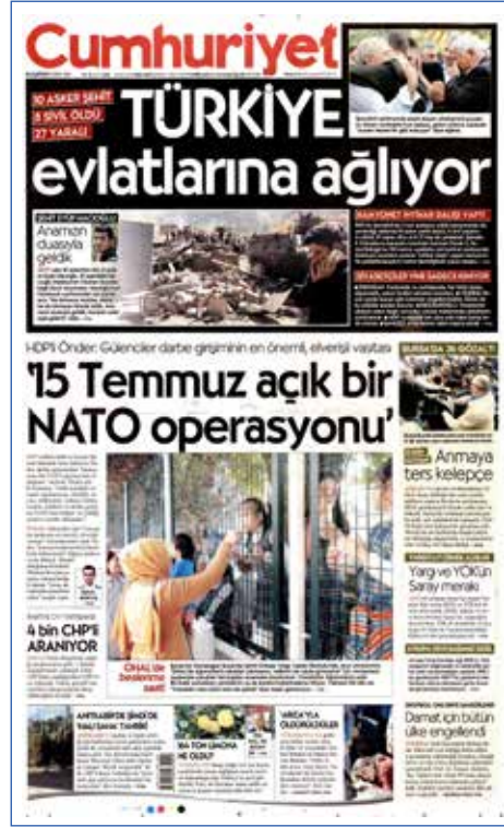
Resim 117, Cumhuriyet, 10 Ekim 2016