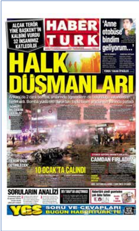
Resim 25, Haber Türk, 14 Mart 2016

13 Mart günü Ankara'nın merkezi Kızılay Güven Park'ta bomba yüklü aracın patlatılması sonucu 33 kişi hayatını kaybetti, 125 kişi yaralandı. Saldırıyı terör örgütü PKK'nın uzantısı TAK üstlendi. Sivil vatandaşların da yaralandığı saldırıyı birçok gazete manşetine "katliam" olarak taşıdı. Sözcü gazetesi ise patlamadan hükümeti sorumlu tutarak devleti güvenlik zafiyetinin önüne geçememekle suçladı.