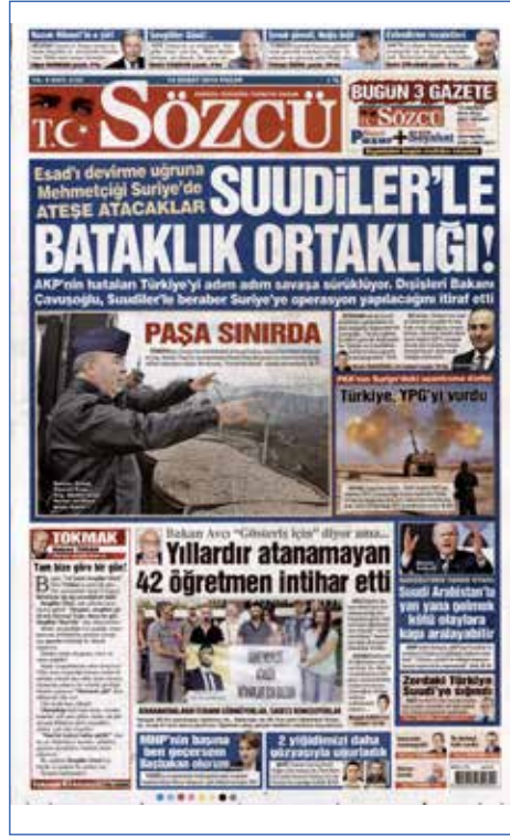
Resim 20, Sözcü, 14 Şubat 2016