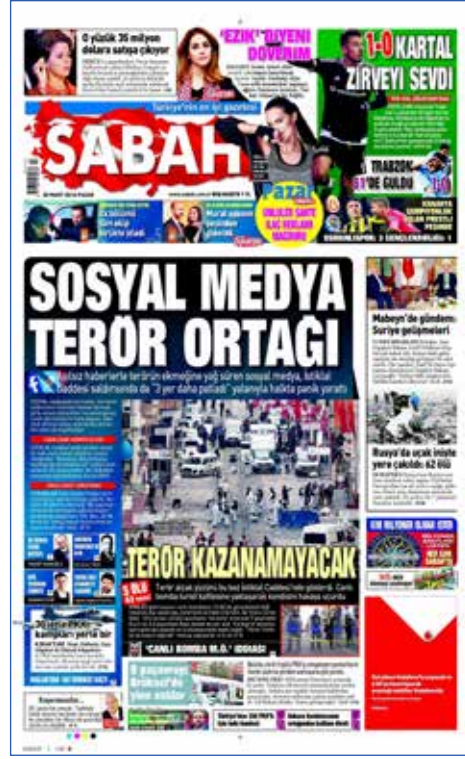
Resim 34, Sabah, 20 Mart 2016