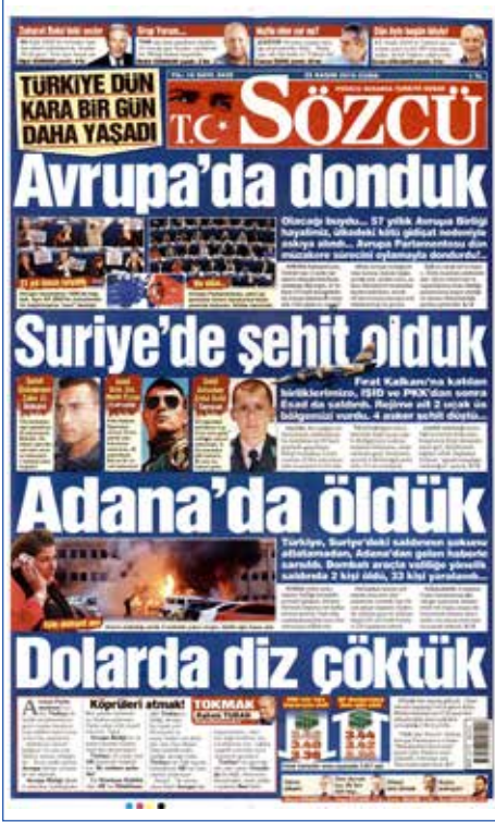
Resim 136, Sözcü, 25 Kasım 2016