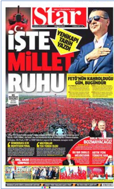
Resim 93, Star, 8 Ağustos 2016