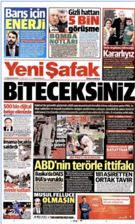
Resim 114, Yeni Şafak , 10 Ekim 2016

9 Ekim'de Hakkari'nin Şemdinli ilçesi Durak Jandarma Karakolu yakınında yol kontrolü sırasında PKK'lı teröristlerin bombalı araçla yaptığı hain saldırı sonucu 10'u asker 18 kişi şehit oldu, 11 asker ile 16 sivil de yaralandı. Arama noktasına kontrolsüz bir şekilde yaklaştığı tespit edilen kamyonete "dur" ihtarına rağmen durmaması üzerine ateş açıldı. Kamyonet nizamiyeden giremeyince yaklaşık 5 ton olduğu düşünülen patlayıcılar infilak ettirildi. Yaşanan acı olayın ardından Yeni Şafak , Hürriyet , Haber Türk , Sözcü ve Cumhuriyet terör karşıtı manşetler atarken BirGün gazetesinin Türkiye'nin asayişinden sorumlu asker ve polisi teröristlerle aynı kefeyle koyarcasına iki tarafa da "Öldürmeyin!" çağrısında bulundu.