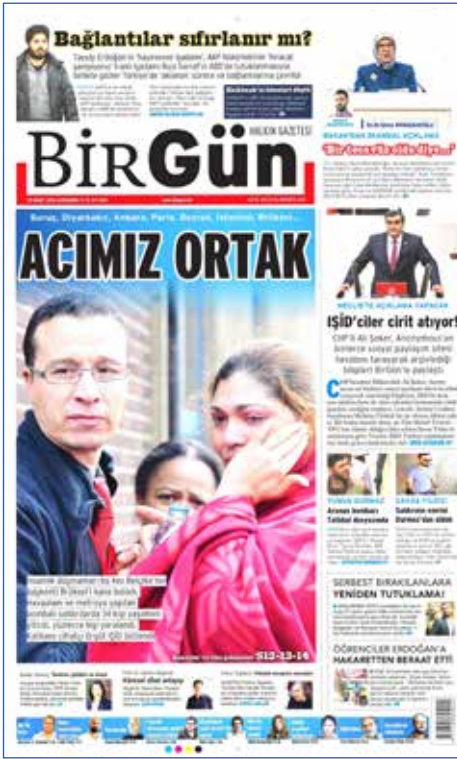
Resim 4: BirGün , 23 Mart 2016