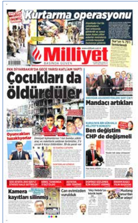
Resim 16, Milliyet, 15 Ocak 2016