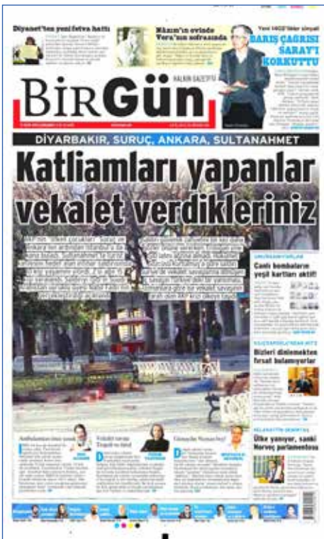
Resim 1: BirGün, 13 Ocak 2016

12 Ocak 2016 günü İstanbul Sultanahmet Meydanı'nda DEAŞ mensubu Suriye kökenli bir canlı bomba tarafından gerçekleştirilen intihar saldırısında 10 kişi hayatını kaybetti. Bölgedeki turist grubu hedef alan saldırı hem Türkiye hem de Batı medyasında yoğun biçimde tartışıldı. Fakat bazı medya organlarının olayı aktarış tarzı, güvenlik zaafından hareketle siyasi iradeyi yıpratmaya dönük bir hal almış ve dolaylı biçimde terör siyasi araç haline getirilmiştir. Bu yönüyle bakıldığında