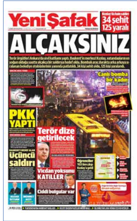
Resim 26, Yeni Şafak, 14 Mart 2016