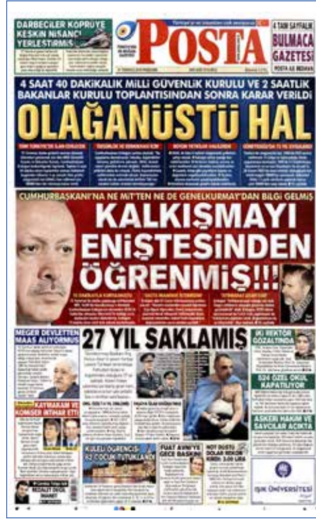
Resim 88, Posta, 21 Temmuz 2016