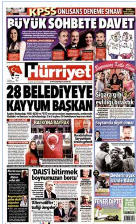
Resim 113, Hürriyet, 12 Eylül 2016