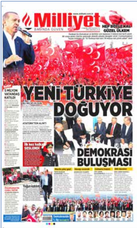
Resim 91, Milliyet , 8 Ağustos 2016

15 Temmuz darbe girişimi sonrasında Cumhurbaşkanı Erdoğan'ın çağrısıyla başlayan Demokrasi Nöbetleri'nin en kapsamlısı 7 Ağustos'ta Yenikapı'da "Demokrasi ve Şehitler Mitingi" adıyla düzenlendi. Cumhurbaşkanı Erdoğan, AK Parti, CHP, MHP liderleri ve Genelkurmay Başkanı Hulusi Akar başta olmak üzere 5 milyon vatandaş Yenikapı Mitingi'ne katıldı. 7 Ağustos Yenikapı Demokrasi ve Şehitler Mitingi darbe sonrası milli birlik ve beraberliğin sembolü haline geldi. Hükümet karşıtı görüşleriyle bilinen Sözcü gazetesi bile "Tek Millet, Tek Bayrak" manşetini attı. Ancak Cumhuriyet gazetesi HDP'nin mitinge katılmamasını "eksik demokrasi" olarak değerlendirdi.