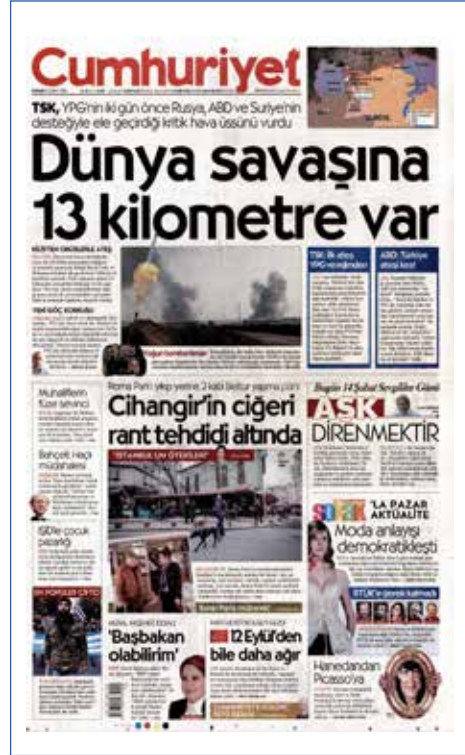
Resim 18, Cumhuriyet , 14 Şubat 2016