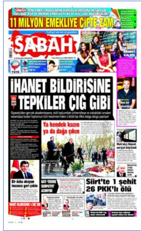
Resim 7, Sabah, 16 Ocak 2016