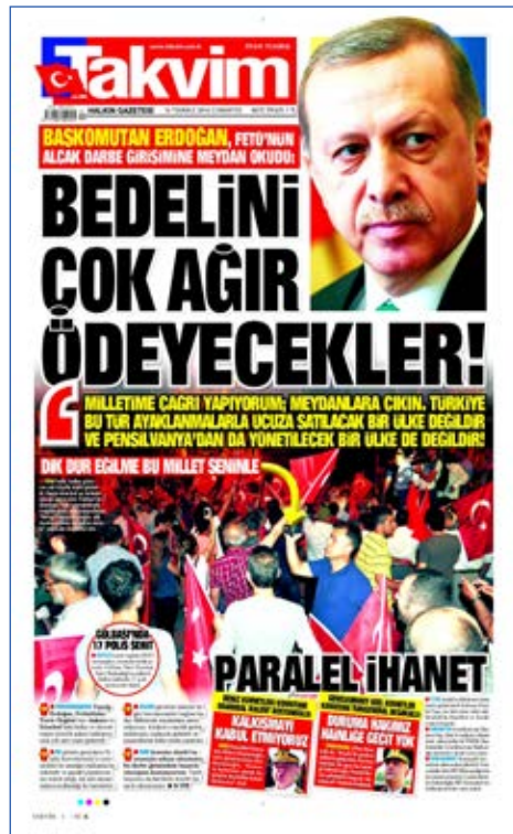
Resim 77, Takvim, 16 Temmuz 2016