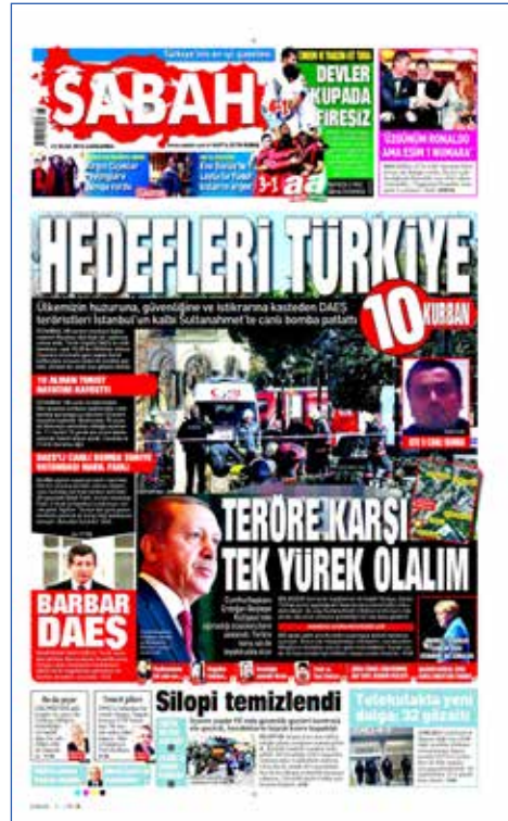
Resim 10, Sabah , 13 Ocak 2016