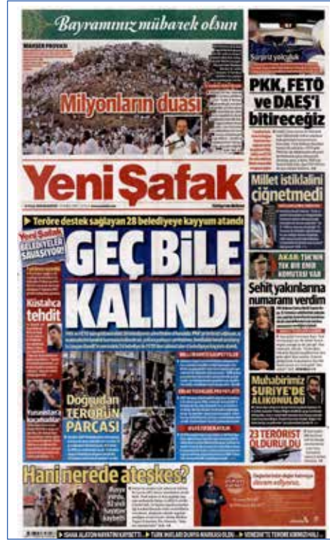
Resim 108, Yeni Şafak, 12 Eylül 2016