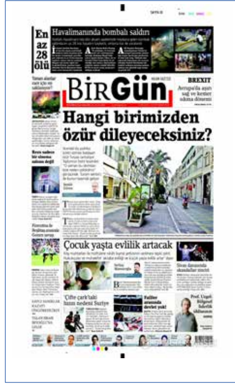
Resim 68, BirGün, 29 Haziran 2016