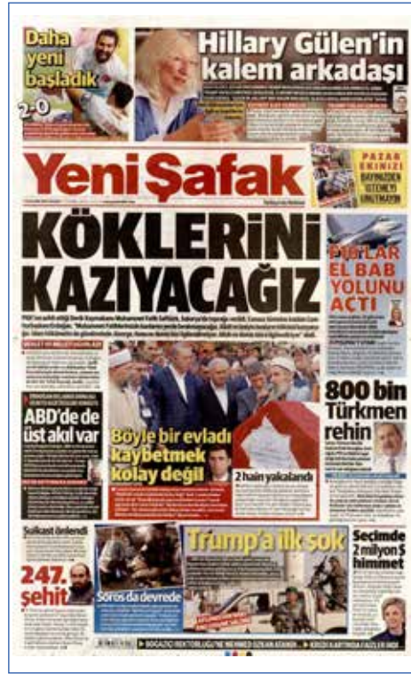
Resim 131, Yeni Şafak, 13 Kasım 2015