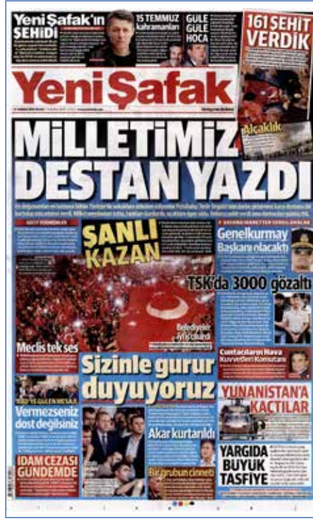
Resim 86, Yeni Şafak , 17 Temmuz 2016