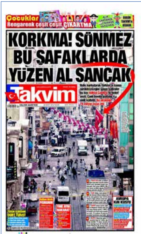
Resim 31, Takvim, 20 Mart 2016