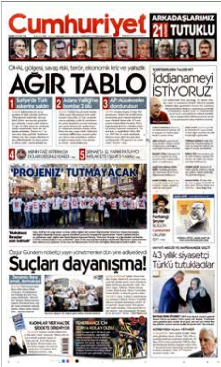
Resim 138, Cumhuriyet, 25 Kasım 2016