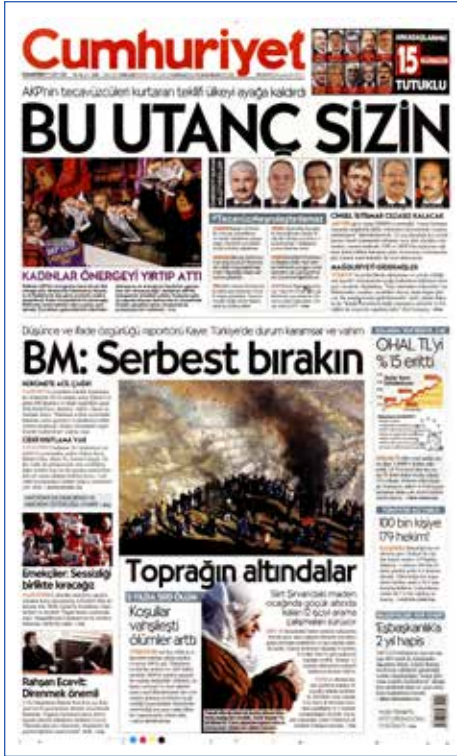
Resim 133, Cumhuriyet, 19 Kasım 2016

18 Kasım'da Siirt'in Şirvan ilçesine bağlı Maden köyünde bulunan Ciner Grubu'na ait bakır madeninde heyelan meydana geldi. AFAD madende çalışan 16 işçinin göçük altında kaldığını açıkladı. Acı olayda son belirlemelere göre beş işçi hayatını kaybetti, 11 işçinin ise cesedine henüz ulaşamadı. Arama kurtarma çalışmaları devam ederken Ciner Grubu'na bağlı Haber Türk gazetesi meydana gelen kazayı Ciner Holding'in adını vermeden birinci sayfasına iki cümleyle taşıdı.