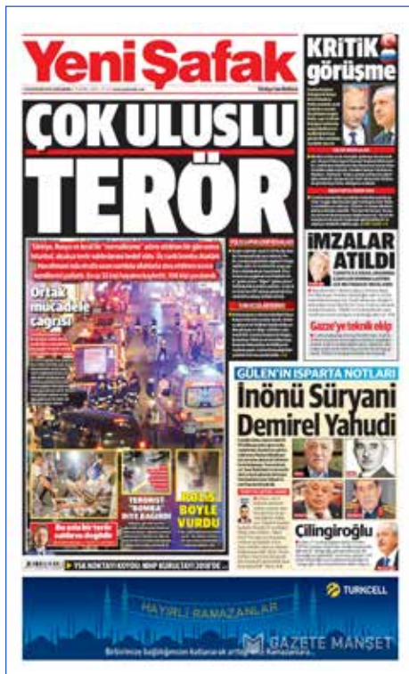
Resim 65, Yeni Şafak, 29 Haziran 2016