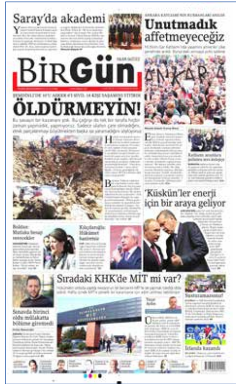
Resim 115, BirGün , 10 Ekim 2016