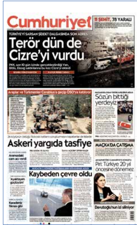
Resim 106, Cumhuriyet, 27 Ağustos 2016