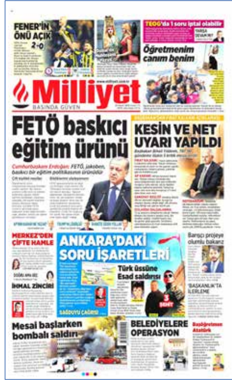
Resim 141, Milliyet, 25 Kasım 2016