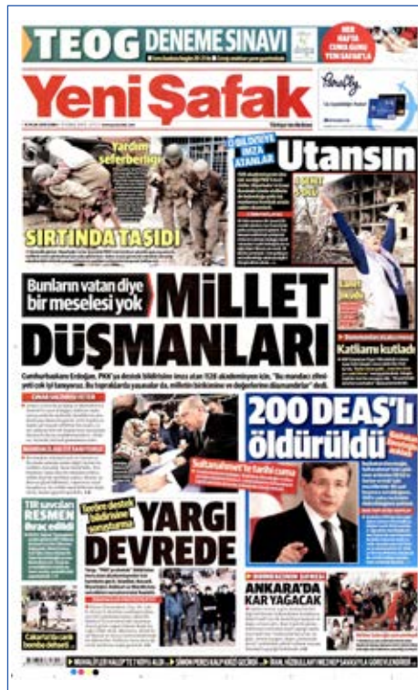
Resim 8, Yeni Şafak, 15 Ocak 2016