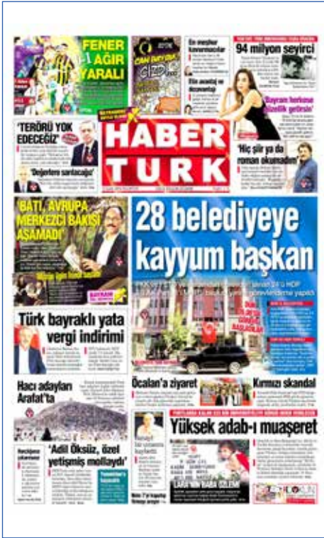
Resim 107, Haber Türk, 12 Eylül 2016