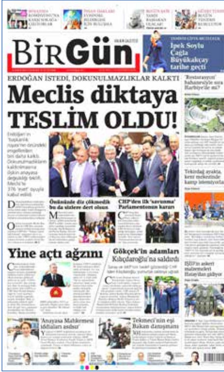
Resim 47, BirGün, 21 Mayıs 2016