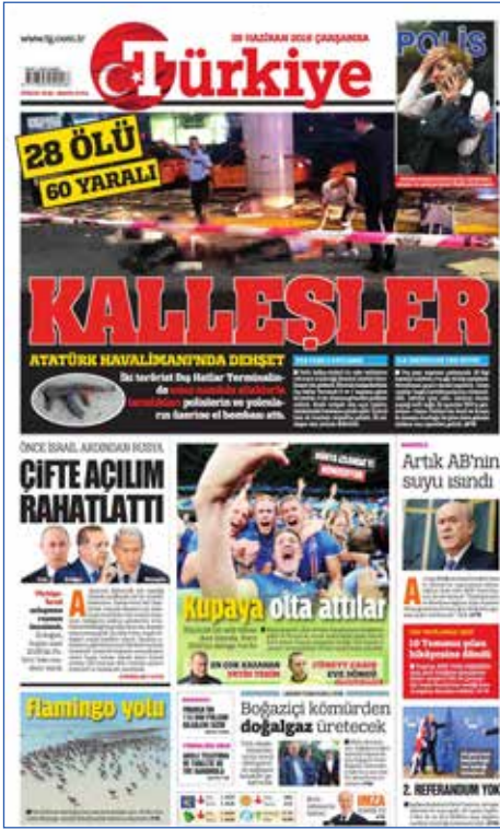
Resim 67, Türkiye, 29 Haziran 2016