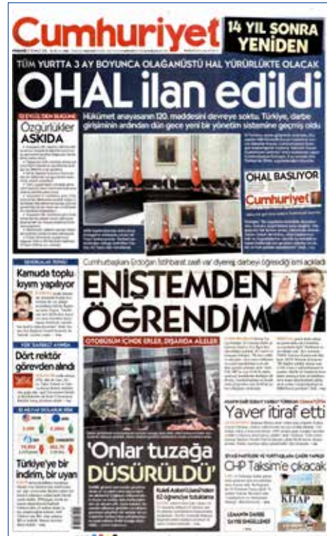
Resim 90, Cumhuriyet, 21 Temmuz 2016