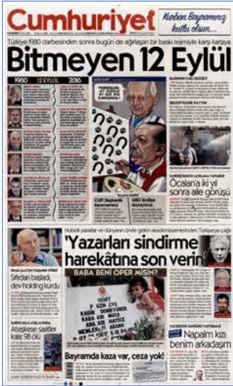
Resim 111, Cumhuriyet, 12 Eylül 2016