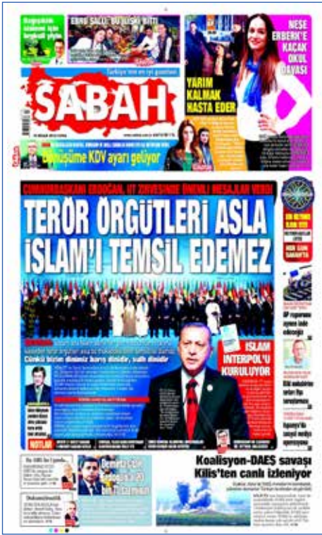
Resim 40, Sabah, 15 Nisan 2016