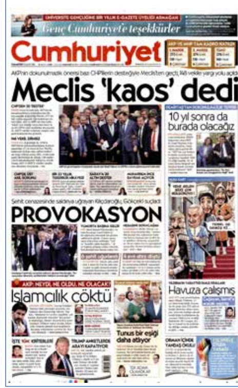
Resim 48, Cumhuriyet, 21 Mayıs 2016