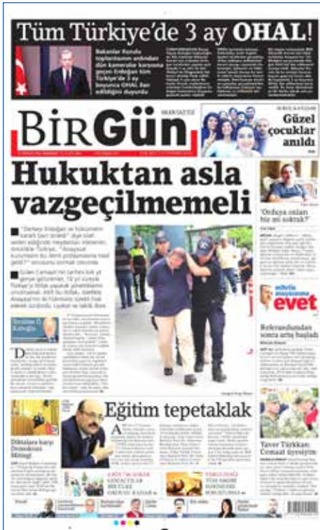
Resim 89, BirGün, 21 Temmuz 2016