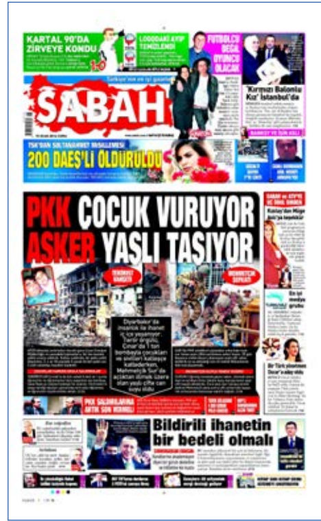
Resim 14, Sabah, 15 Ocak 2016