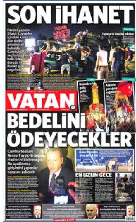
Resim 75, Vatan, 16 Temmuz 2016