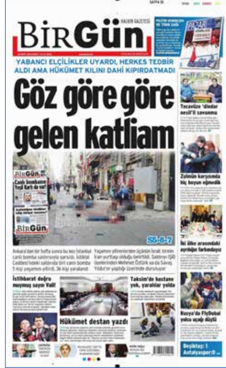
Resim 3: BirGün, 20 Mart 2016

İdeolojik kaygılarla haber yaparak niteliği gereği asimetrik olan terörün salt iktidar zaafı ile gerçekleştiğini söylemek inandırıcı olmaktan uzaktır. Aksi takdirde terör saldırılarının güvenlik standartları açısından azami hassasiyet gösteren Batı ülkelerinde görülmesi açıklanamaz bir durum olurdu. Nitekim Mart ayında Belçika'da yaşanan terör saldırısı sonucunda medyanın tutumu farklı olmuş, ülke yönetimi ve medyası bu konuda yüksek duyarlılık göstermiştir. Fakat konunun ele alınan medya organlarında temsil edilmiş biçimi Türkiye örneğiyle karşılaştırdığımızda oldukça farklı sonuçların ortaya çıkması anlamına gelmektedir.