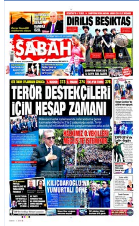
Resim 50, Sabah, 21 Mayıs 2016