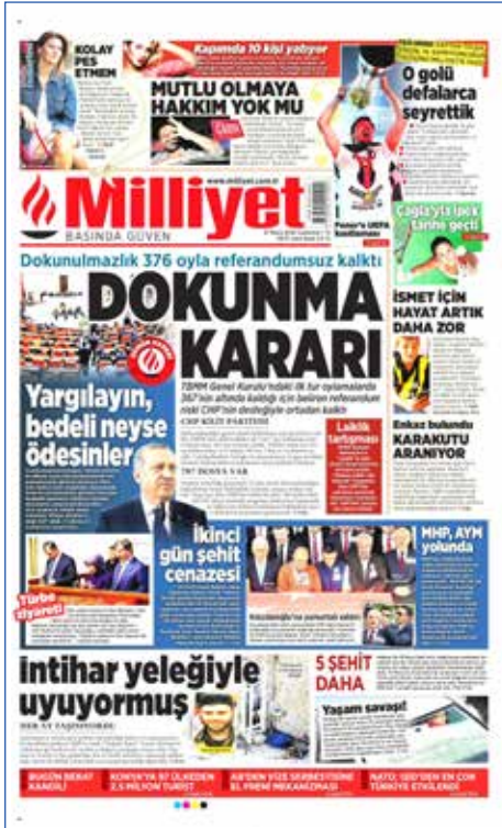
Resim 49, Milliyet, 21 Mayıs 2016