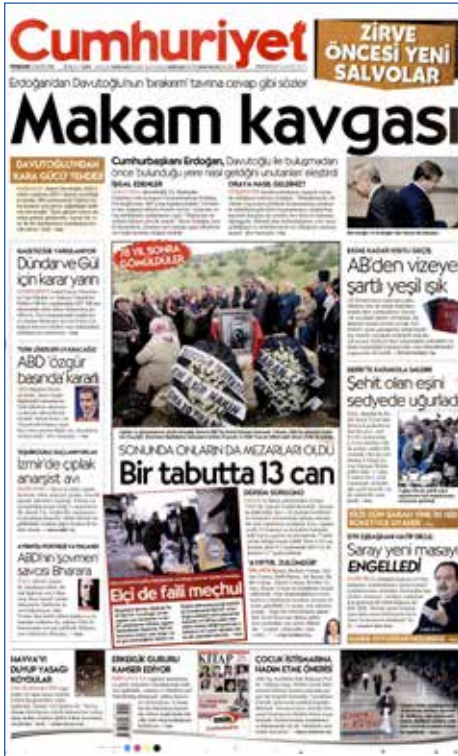
Resim 43, Cumhuriyet, 5 Mayıs 2016

AK Parti Genel Başkanı ve Başbakan Ahmet Davutoğlu, 5 Mayıs'taki MYK toplantısı sonrası "22 Mayıs'ta olağanüstü kongre yapılacağını ve kongrede aday olmayacağını" açıkladı. AK Parti'nin 3. Genel Başkanı'nın seçileceği olağanüstü kongre Cumhuriyet ve BirGün gazeteleri tarafından Erdoğan ile Davutoğlu arasında bir husumetin ortaya çıkışı olarak manşete taşındı. Milliyet gazetesi ise AK Parti'de yeni bir dönemin başladığına işaret etti.