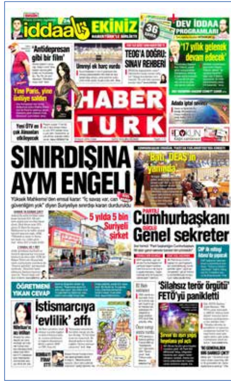
Resim 135, Haber Türk, 18 Kasım 2016