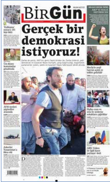
Resim 82, BirGün, 17 Temmuz 2016