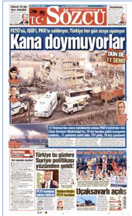
Resim 104, Sözcü , 27 Ağustos 2016