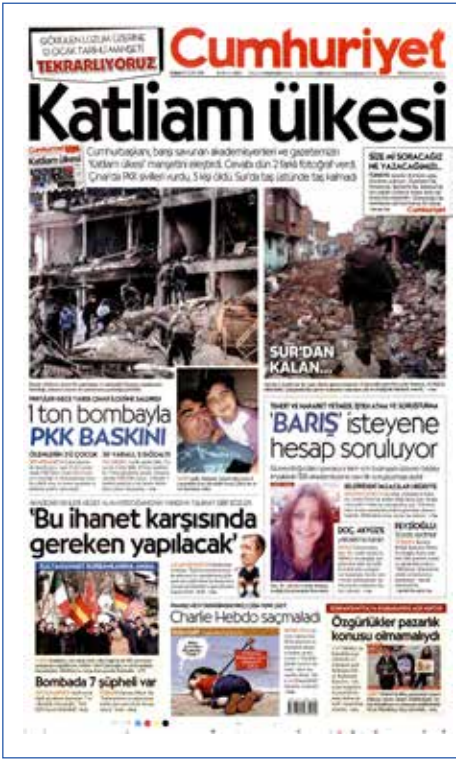
Resim 13, Cumhuriyet, 15 Ocak 2016