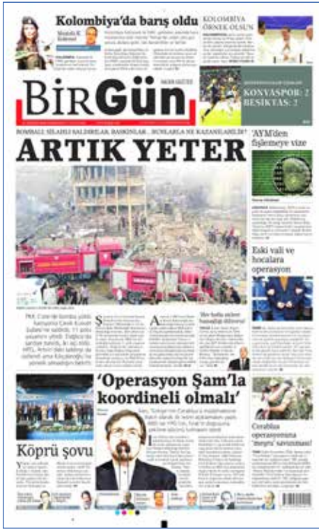
Resim 105, BirGün, 27 Ağustos 2016