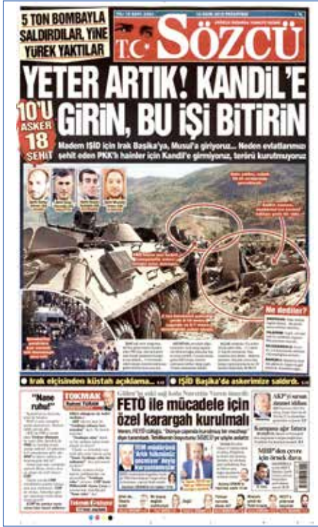
Resim 116, Sözcü, 10 Ekim 2016