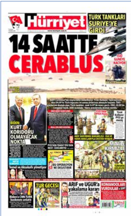
Resim 101, Hürriyet, 25 Ağustos 2016