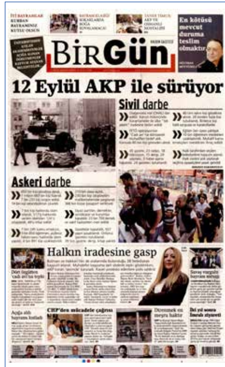
Resim 110, BirGün, 12 Eylül 2016