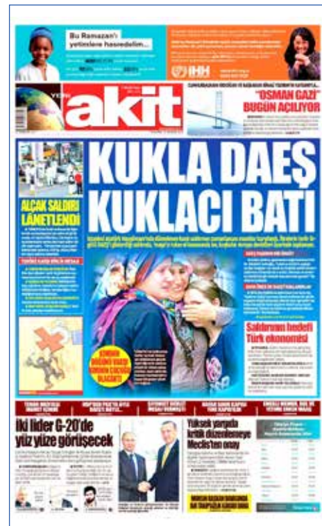
Resim 66, Akit, 30 Haziran 2016