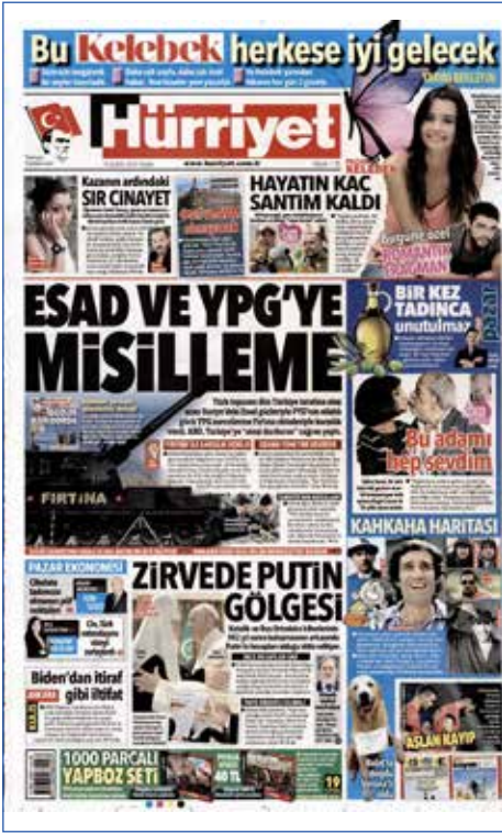
Resim 19, Hürriyet, 14 Şubat 2016