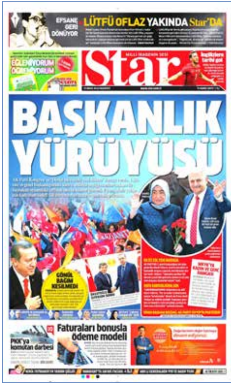
Resim 53, Star, 23 Mayıs 2016