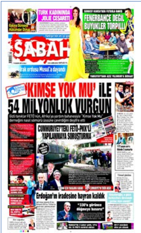
Resim 120, Sabah, 1 Ekim 2016