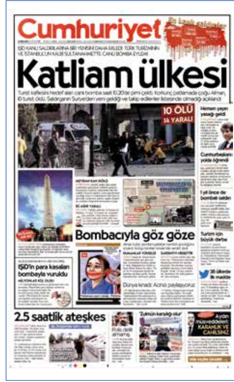
Resim 12, Cumhuriyet, 13 Ocak 2016