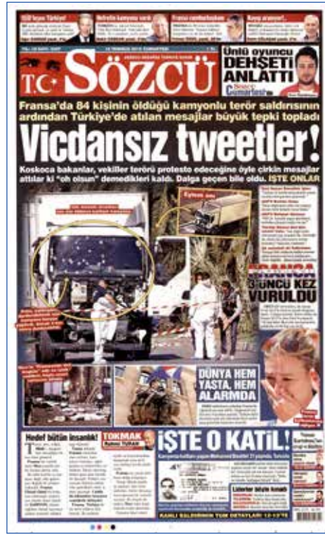
Resim 79, Sözcü, 16 Temmuz 2016