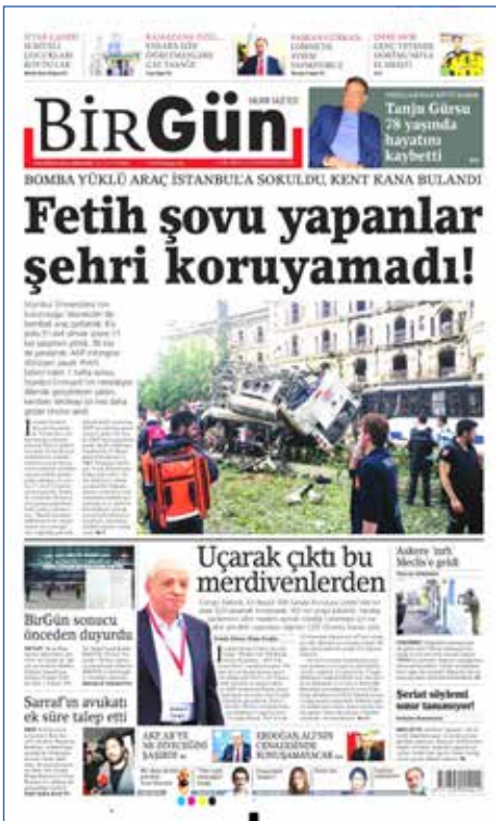
Resim 57, BirGün, 8 Haziran 2016