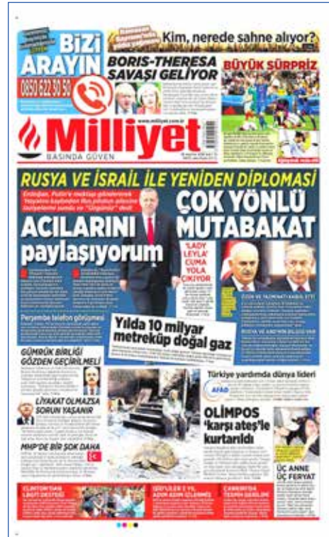
Resim 60, Milliyet , 28 Haziran 2016