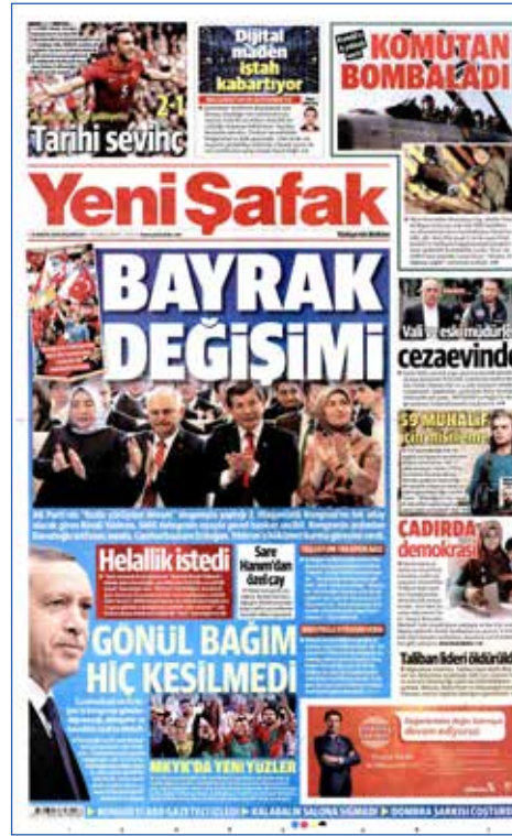
Resim 54, Yeni Şafak, 23 Mayıs 2016