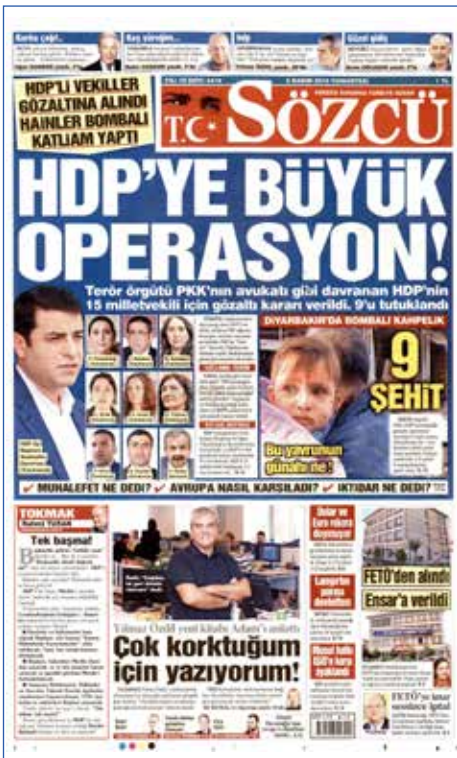
Resim 126, Sözcü, 5 Kasım 2016