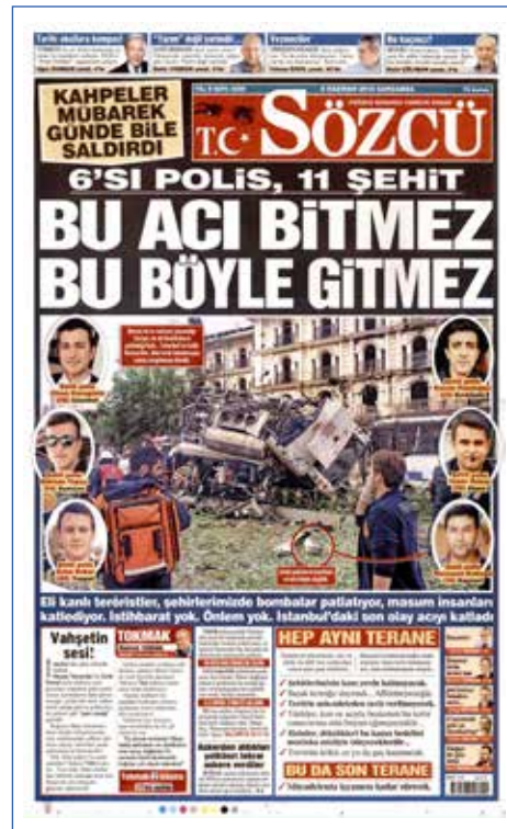
Resim 58, Sözcü, 8 Haziran 2016