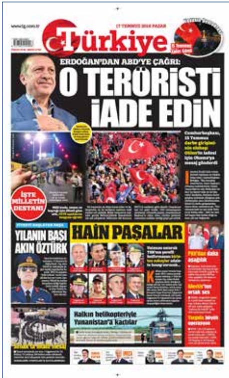
Resim 84, Türkiye, 17 Temmuz 2016