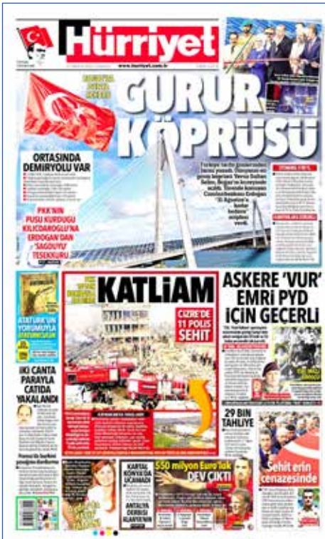
Resim 103, Hürriyet , 27 Ağustos 2016

26 Ağustos'ta Yavuz Sultan Selim Köprüsü ve Kuzey Otoyolu açıldı. Üzerinde raylı sistem bulunan, dünyanın en uzun ve en yüksek asma köprüsü olma özelliğini taşıyan köprü İstanbul'un Sarıyer ilçesindeki Garipçe köyü ile Beykoz ilçesindeki Poyrazköy arasında bulunuyor. Açılış töreni Cumhurbaşkanı Erdoğan ve Başbakan Yıldırım'ın yanı sıra Türkiye ve dünyanın dört bir yanından gelen birçok siyasetçinin katılımıyla gerçekleşti. Hürriyet , Star , Milliyet , Haber Türk ve Yeni Şafak gazeteleri köprü açılışını manşetlerine taşıırken Cumhuriyet , Sözcü ve BirGün gazeteleri bu büyük hizmetten kısaca bahsetmekle yetindi.