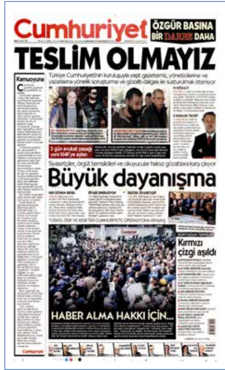
Resim 119, Cumhuriyet, 1 Kasım 2016