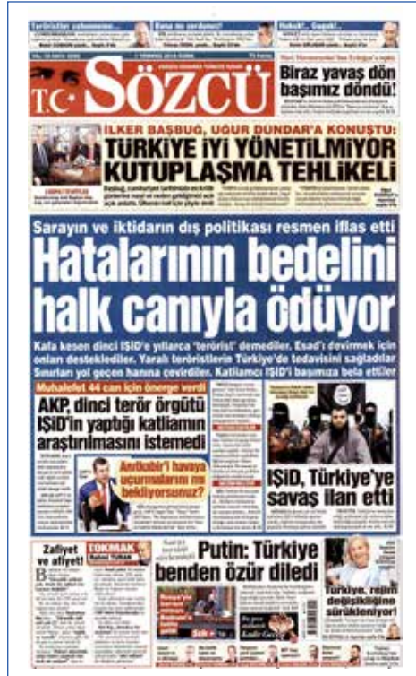
Resim 72, Sözcü, 1 Temmuz 2016