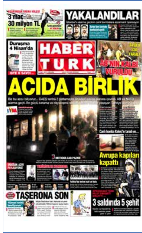
Resim 39, Haber Türk, 23 Mart 2016