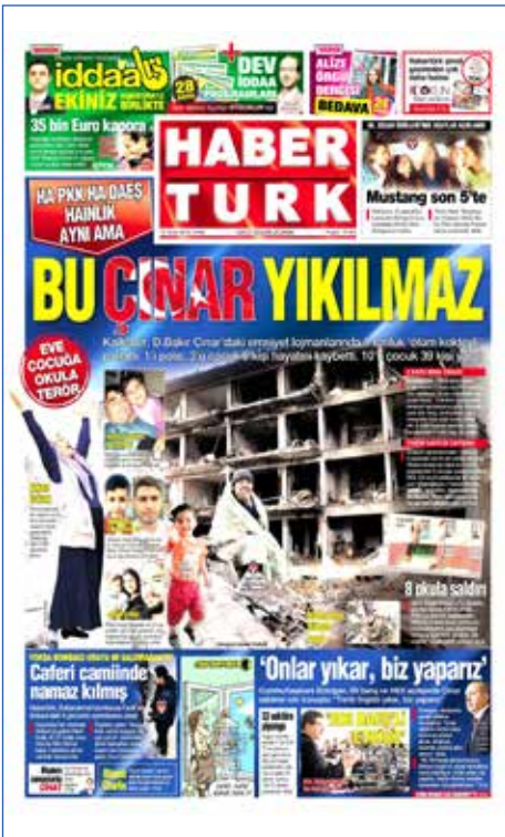
Resim 15, Haber Türk, 15 Ocak 2016