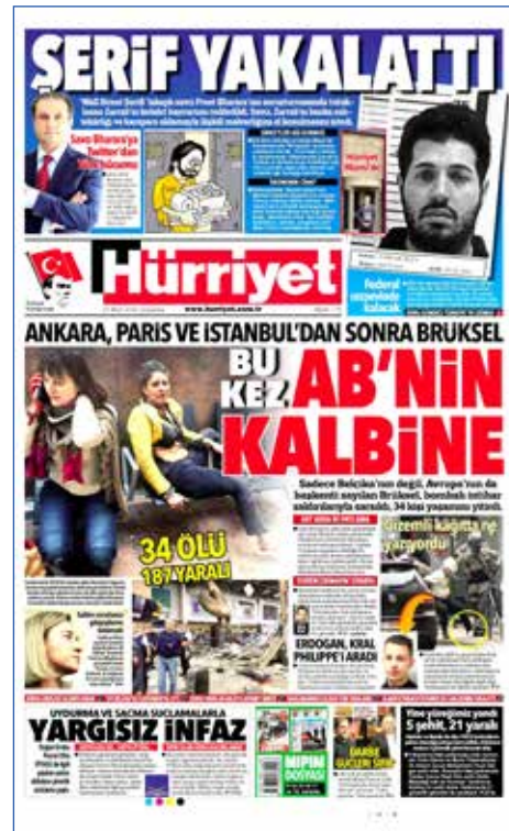
Resim 38, Hürriyet, 23 Mart 2016