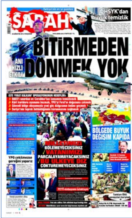
Resim 99, Sabah, 25 Ağustos 2016