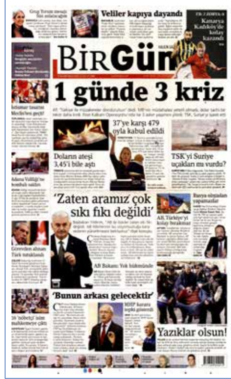
Resim 137, BirGün, 25 Kasım 2016