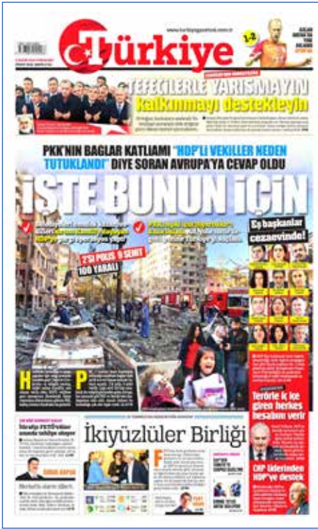
Resim 124, Türkiye, 5 Kasım 2016