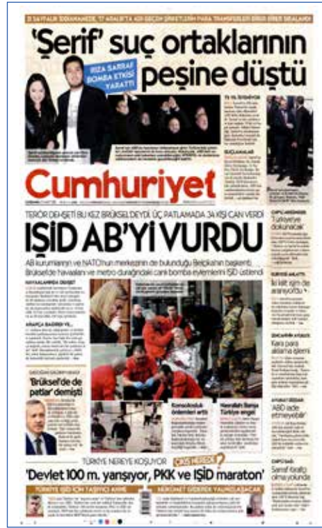
Resim 36, Cumhuriyet, 23 Mart 2016