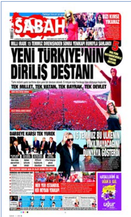
Resim 95, Sabah, 8 Ağustos 2016