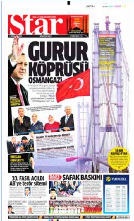
Resim 71, Star, 1 Temmuz 2016