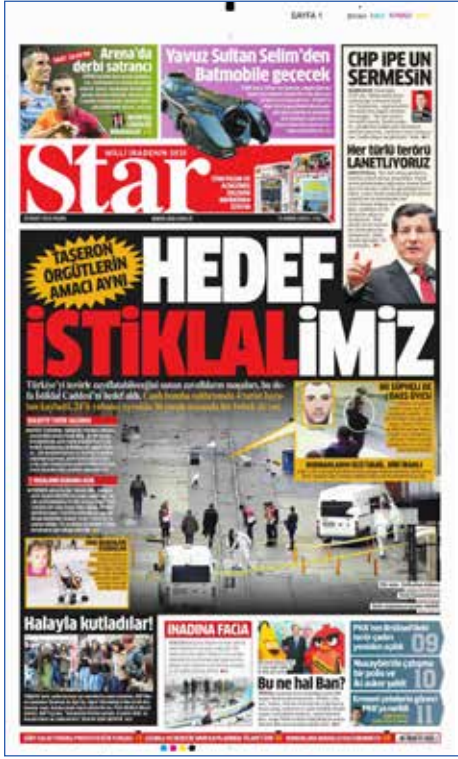
Resim 33, Star, 20 Mart 2016