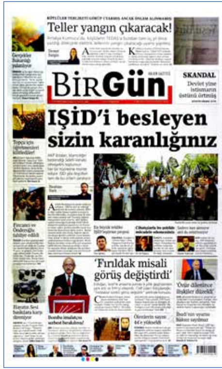
Resim 73, BirGün , 1 Temmuz 2016