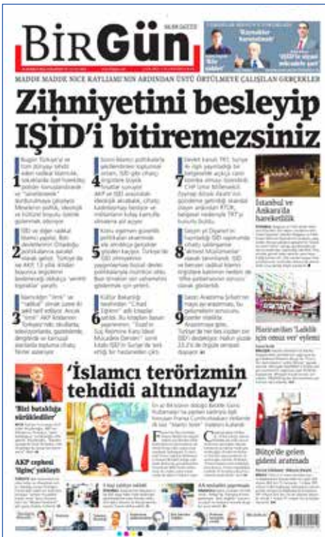
Resim 80, BirGün, 16 Temmuz 2016