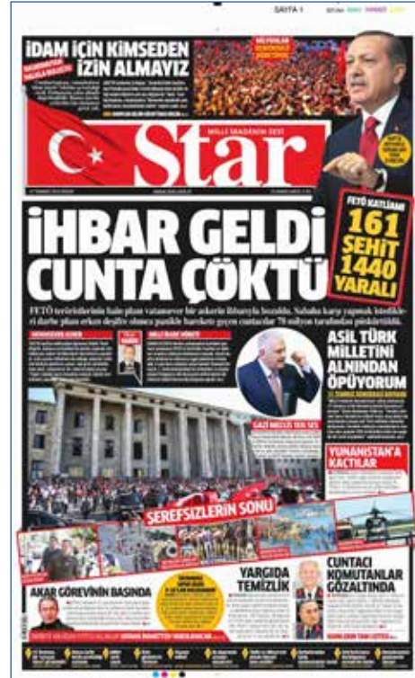
Resim 85, Star, 17 Temmuz 2016