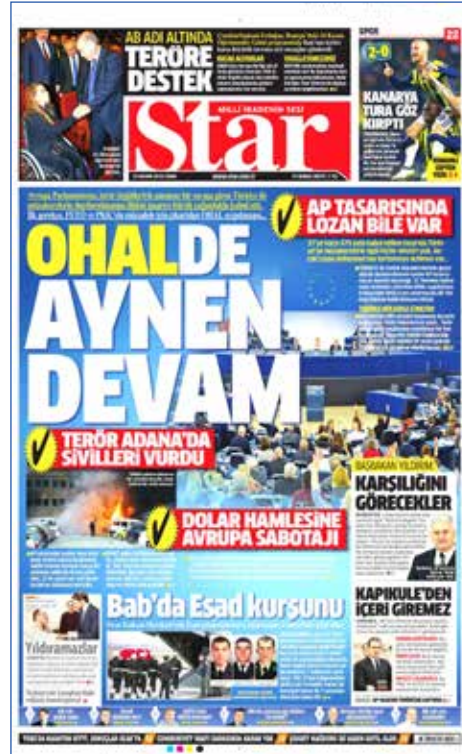
Resim 139, Star, 25 Kasım 2016