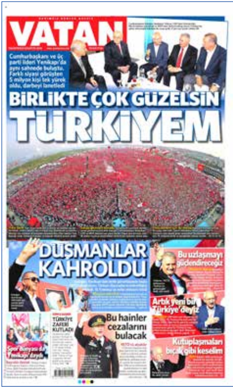
Resim 97, Vatan, 8 Ağustos 2016