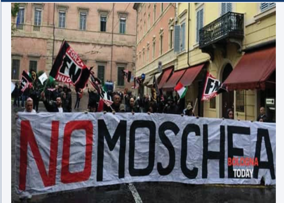
FIGURA 1: STRISCIONE DI PROTESTA CONTRO LA MOSCHEA A BOLOGNA DI FORZA NUOVA (6 OTTOBRE, 2018), 19

A giugno, i consiglieri di Fratelli d'Italia del Comune di Napoli hanno esposto un grande striscione con la scritta "Piazza dell'Islam" (anziché "Piazza Garibaldi") in aperto contrasto con il sindaco di Napoli Luigi De Magistris, "colpevole di aver permesso che il centro storico della città si sia trasformato completamente a causa degli arrivi incontrollati di richiedenti asilo e migranti illegali" 20