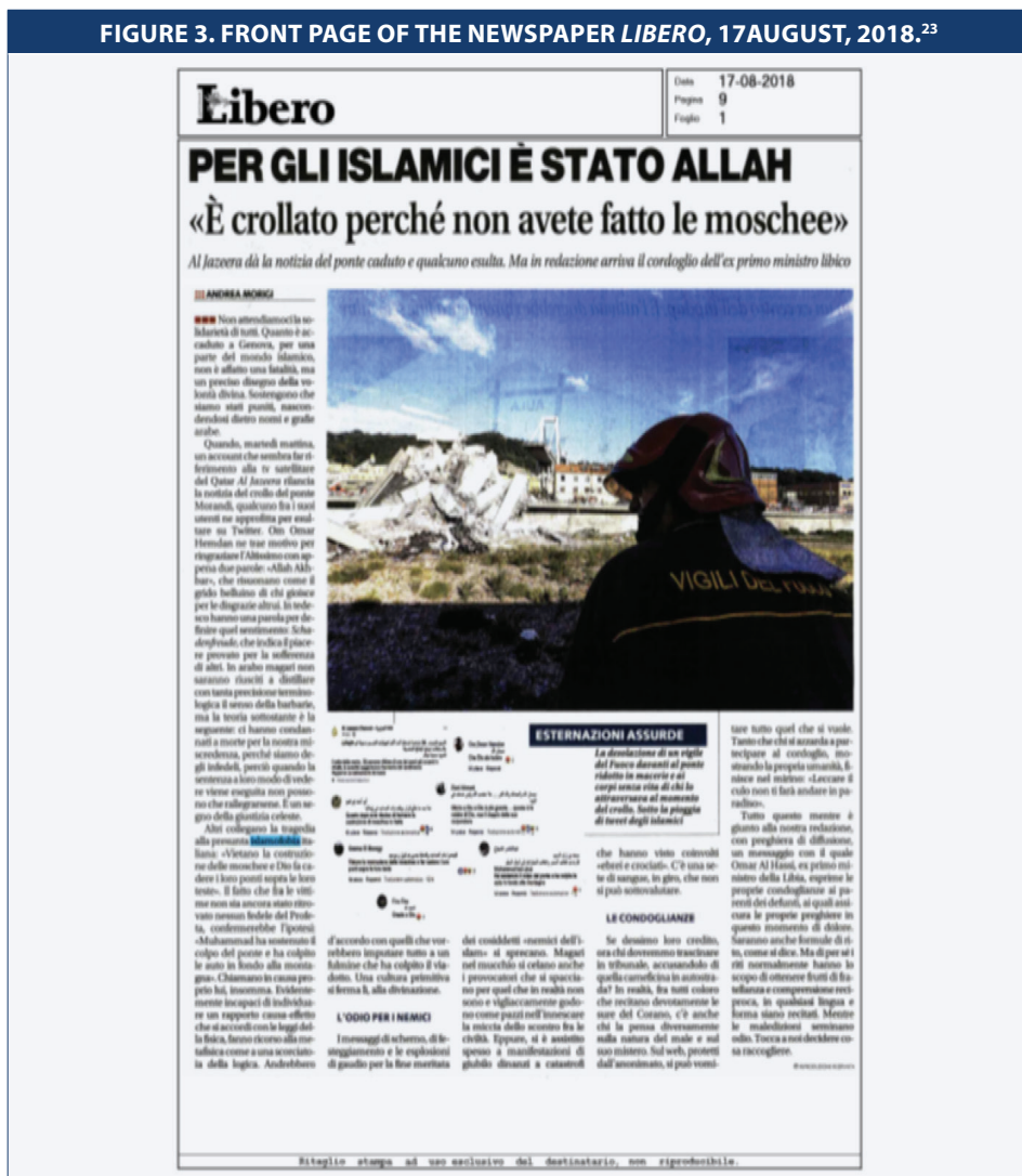
FIGURE 3. FRONT PAGE OF THE NEWSPAPER LIBERO, 17 AUGUST, 2018. 23

In precedenza, all'inizio di febbraio, un giornalista de Il Foglio aveva pubblicato il libro Il suicidio della cultura occidentale: Così l'Islam radicale sta vincendo . La tesi di questo libro è un argomento "tipico": la minaccia dell'islamizzazione control'Europa e la sconfitta del cristianesimo e delle culture occidentali causata dal nostro decadimento e cedevolezza "multiculturale".