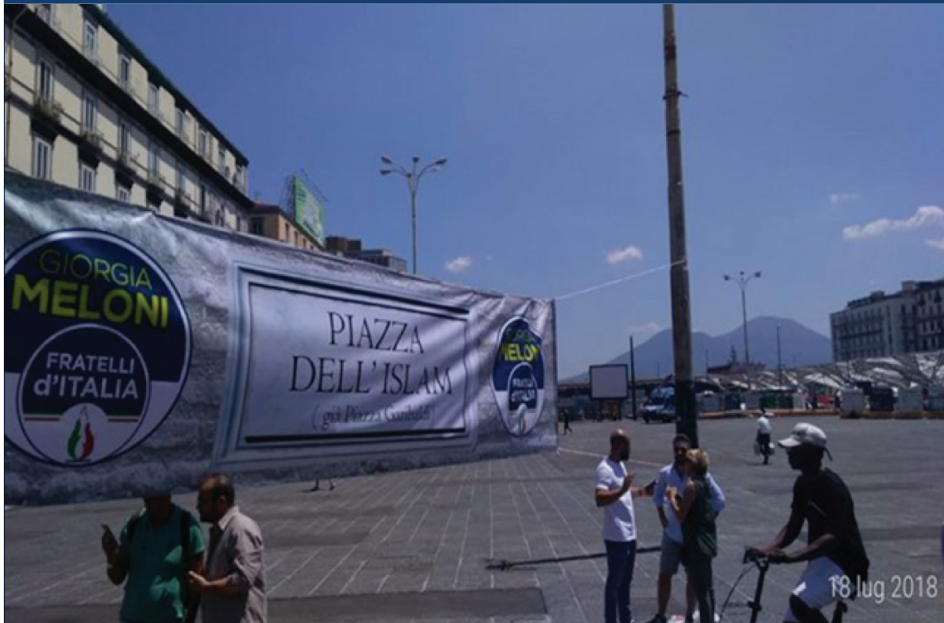
FIGURE 2: LO STRISCIONE AFFISSO DA FRATELLI D'ITALIA NELLA PIAZZA CENRALE DI NAPOLI (18 LUGLIO, 2018)