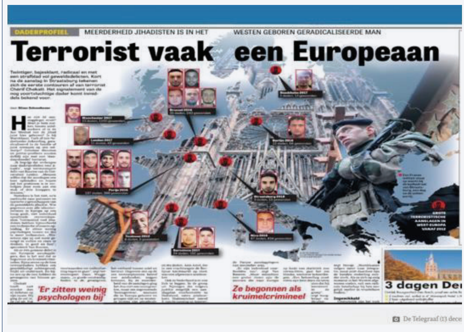
AFBEELDING 7: PAGINA UIT KRANT DE TELEGROAF, 1 DECEMBER 2018, MET DE KOP 'DE TERRORISTEN ZIJN VAAK EEN EUROPEAAN' MET EEN FOTO'S VAN DE TERRORISTEN 55

De Telegraaf besteedde ook veel aandacht aan een promotieonderzoek over salafisten. Dit onderzoek bleek problematisch in de zin van het volgen van wetenschappelijke normen. Maar blijkbaar was dit niet belangrijk voor De Telegraaf.