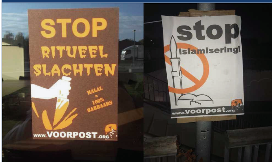
AFBEELDING 3: POSTERS OPGEHANGEN VOOR DE MOSKEE DOOR EXTREEMRECHTSE GROEPERING VOORPOST IN EDE. 23

Een verband tussen sociale gebeurtenissen zoals terreuraanslagen en politieke debatten en anti-moslimaanslagen wordt niet altijd waargenomen. Aanslagen op moskeeën vinden regelmatig plaats in de vorm van protesten en zijn vaak goed georganiseerd. De protesten worden aangekondigd op sociale media, bijna elke gemeente heeft zijn eigen lokale groep, of deze protesten worden op landelijk niveau gemobiliseerd door nationale groepen als Pegida Nederland. Islamitische scholen en moskeeën zijn het vaakst doelwit van deze organisaties die op zowel lokaal als nationaal niveau actief zijn. De leden van deze extreemrechtse groepen zijn niet langer bang om te worden geïdentificeerd. Dit was in verleden wel het geval. Een actie of een aanslag tegen een moskee werd meestal anoniem uitgevoerd. Tegenwoordig schrijft men de betreffende naam op de op te hangen posters en tracht men zo media-aandacht te trekken (Afb. 3). Dit alles geeft aan dat extreemrechtse groepen niet alleen streven naar normalisatie van hun acties, maar portretteren deze aanvallen tevens als legitieme (politieke) protestacties.