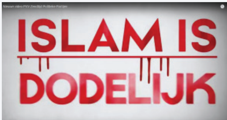
AFBEELDING 5: PVV-UITZENDCAMPAGNE MET DE TEKST: "ISLAM IS DODELIJK."

Deze campagne leidde echter al snel tot weerzin. De reacties bleven niet beperkt tot het leveren van kritiek. Het publiek nam actief deel aan de discussie en op sommige borden werden slogans zoals "Islam is groot" met soortgelijke schrijfwijze als die van de PVV-campagne geschreven en verspreid. (Afb. 6).