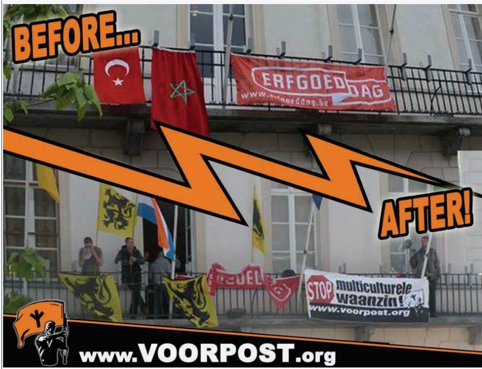
AFBEELDING. 10. SCREENSHOT VAN DE INTERNETPAGINA VAN DE EXTREEMRECHTSE GROEP. 67