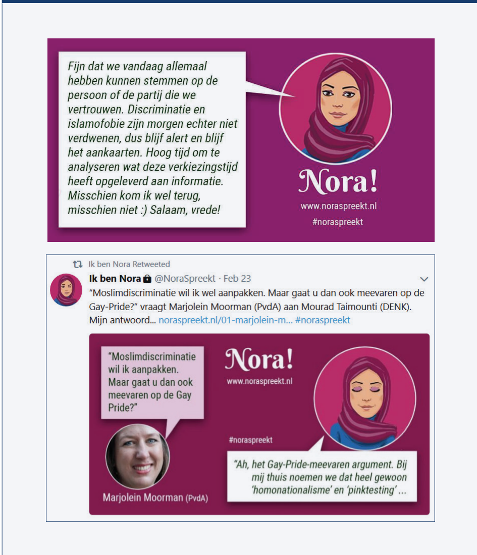
AFBEELDING. 11: SCREENSHOT VAN DE INTERNETPAGINA VAN NORASPREKT.NL. 78